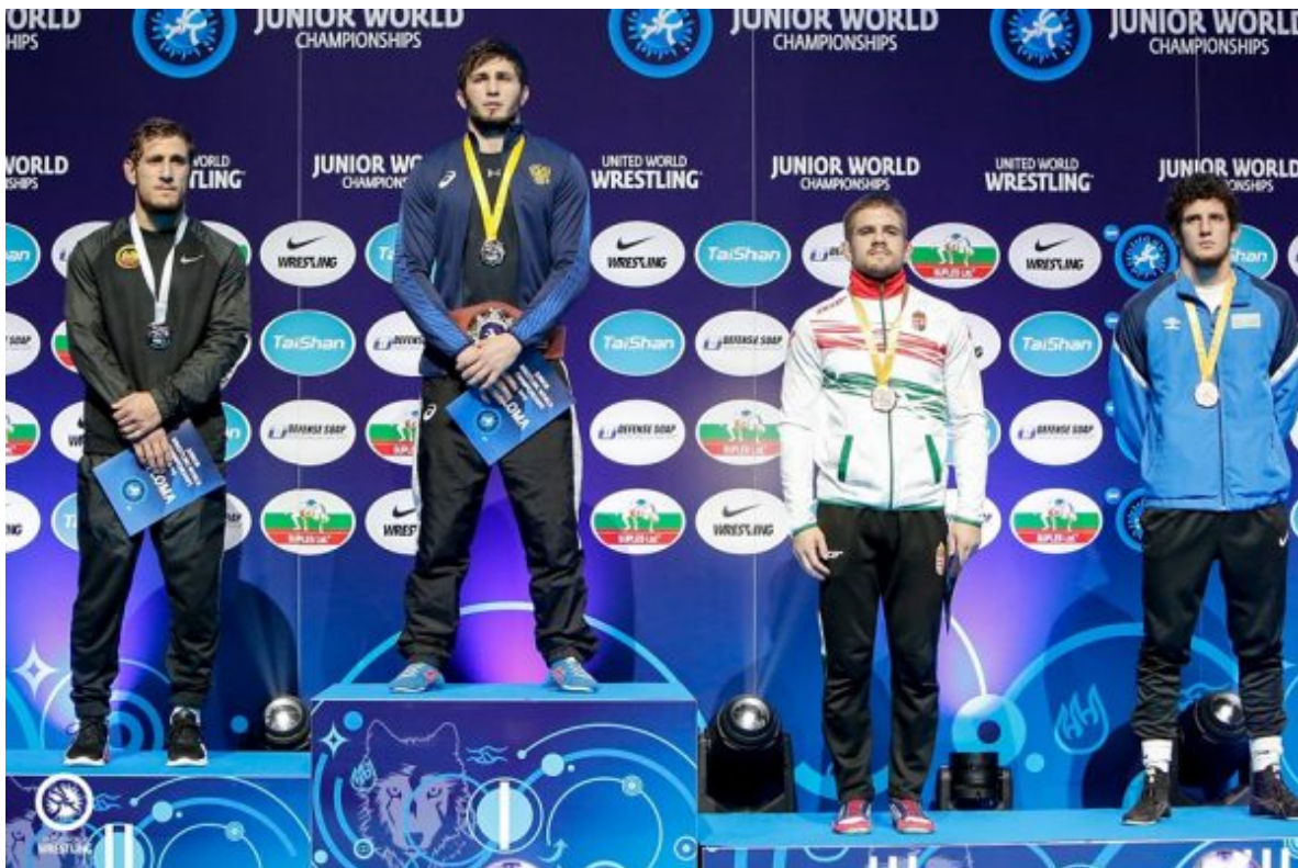
Ахмад Ташухаджиев – чемпион мира-19 среди юниоров