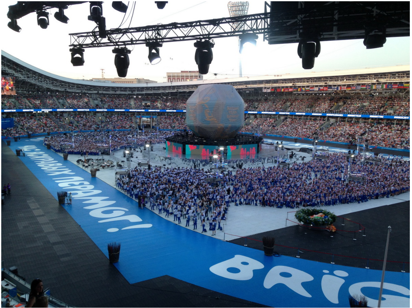
На церемонии закрытия Игр