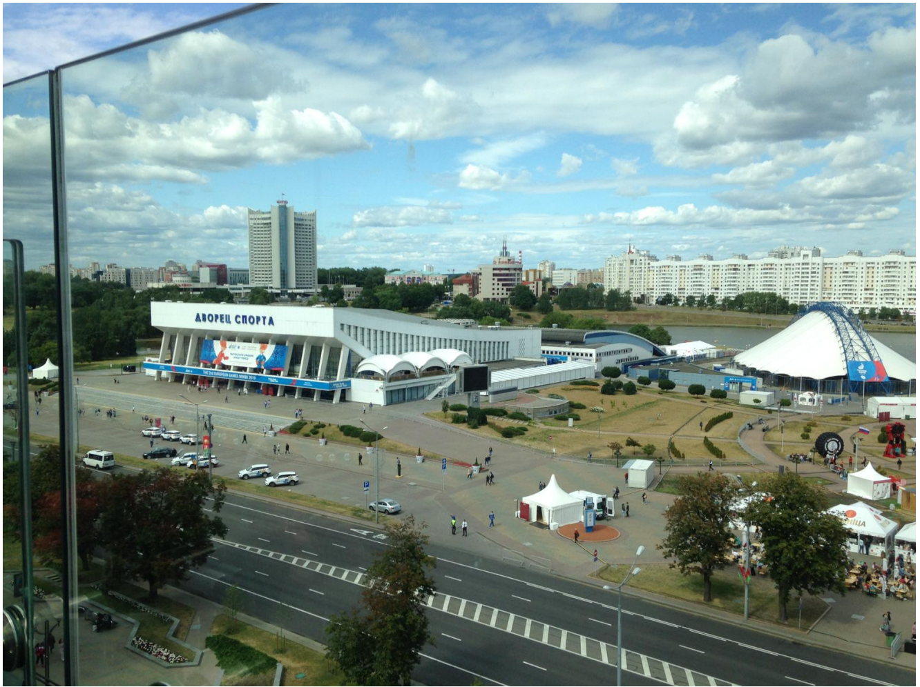
Дворец спорта, где проходили Игры