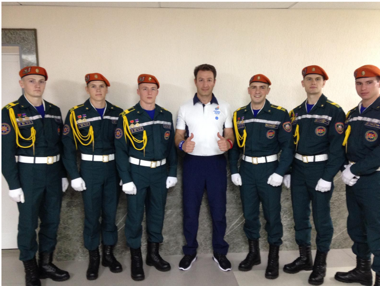
Под надежной охраной