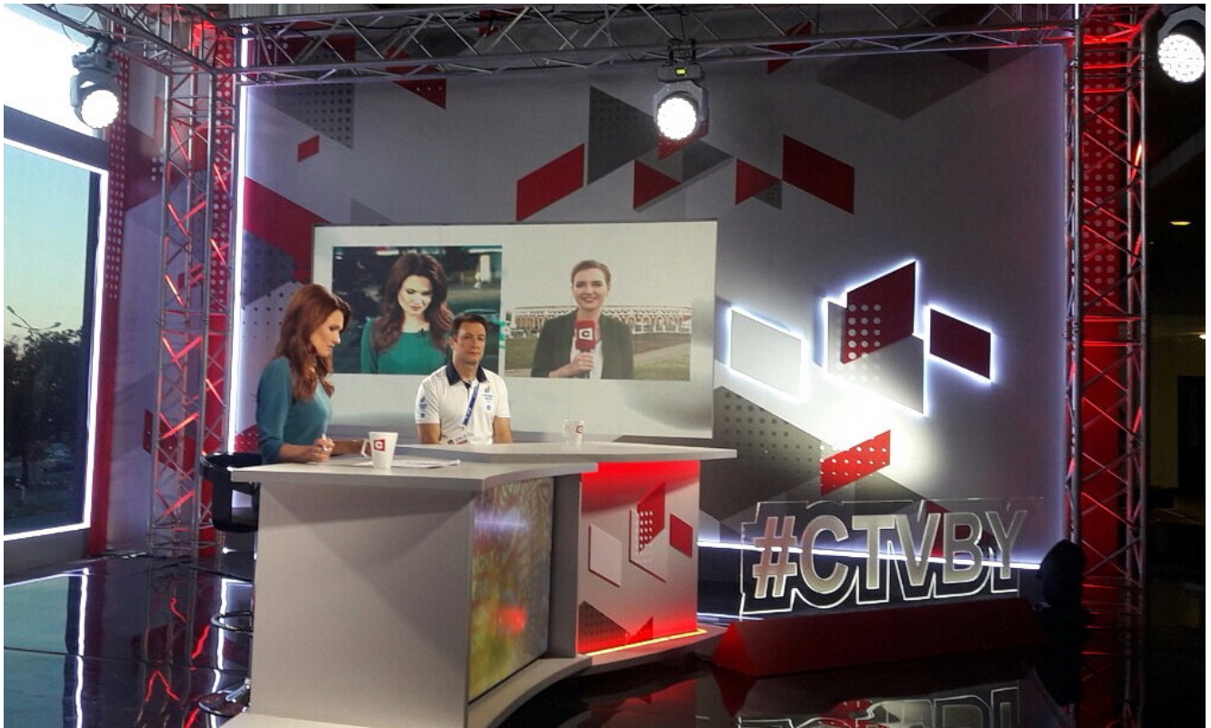
На белорусском телевидении