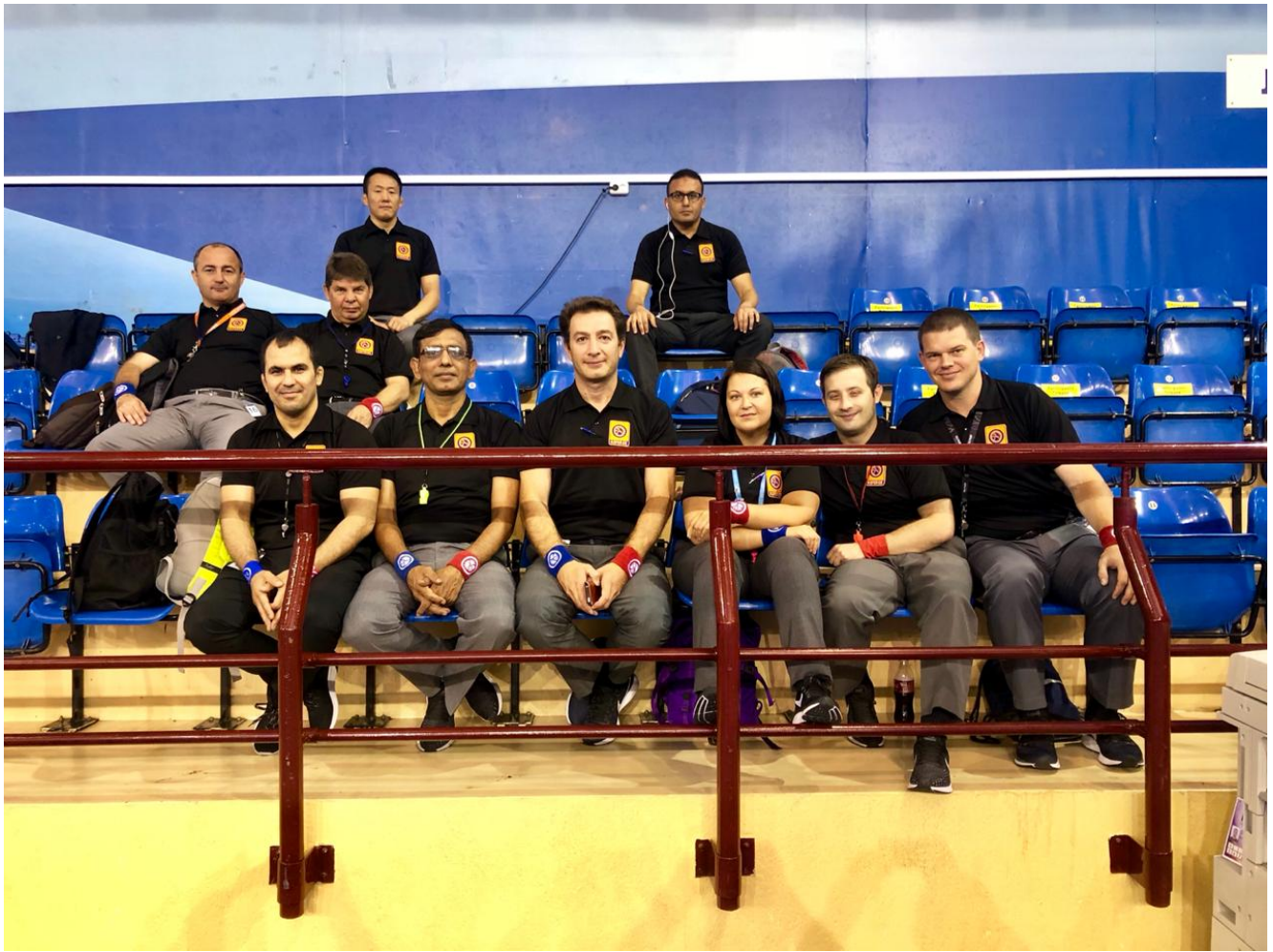
С коллегами - судьями