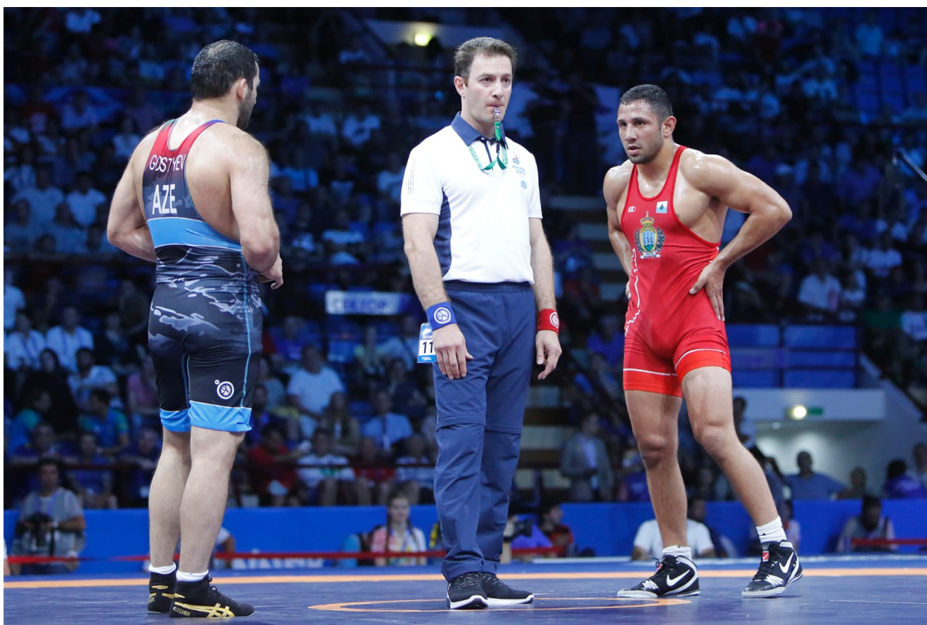
Схватка за бронзовую медаль между представителями Сан-Марино и Азербайджана