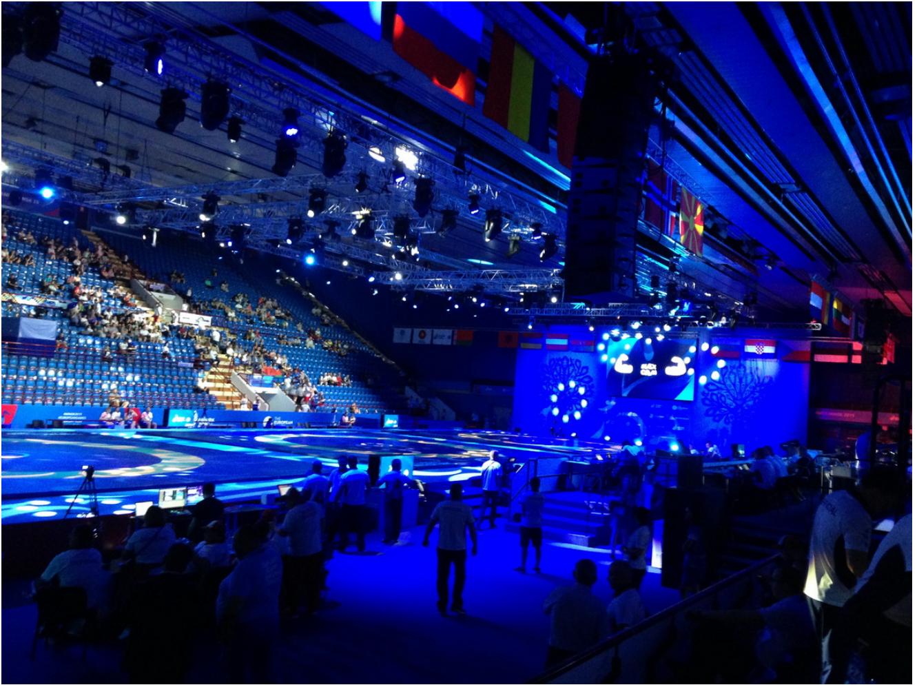
Дворец спорта, где проходили Игры