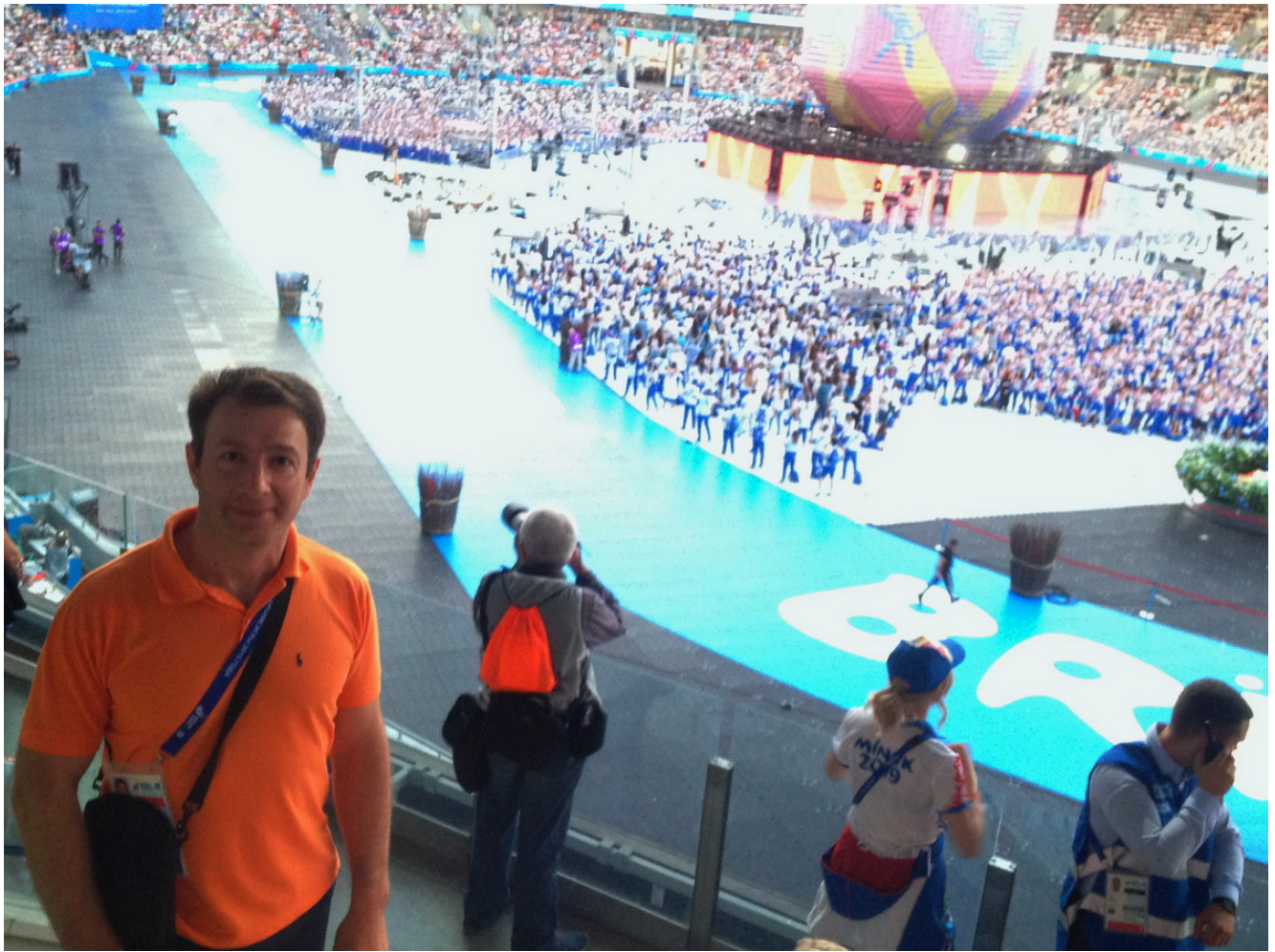
На церемонии закрытия Игр