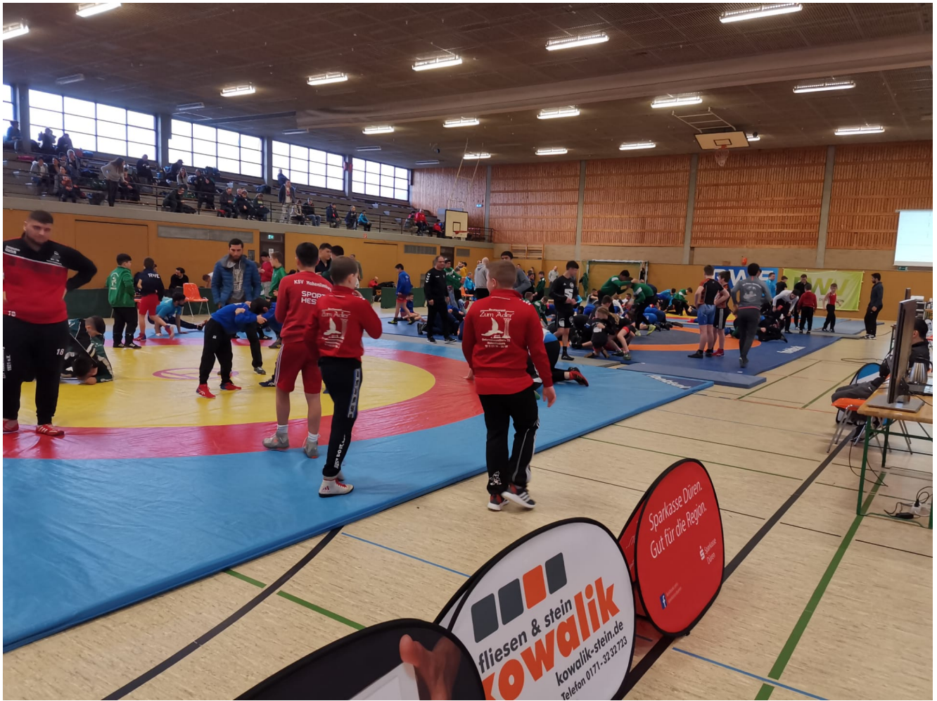
Первенство земли Северный Рейн-Вестфалия