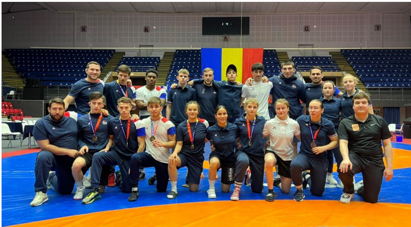
Команда Франции в Румынии