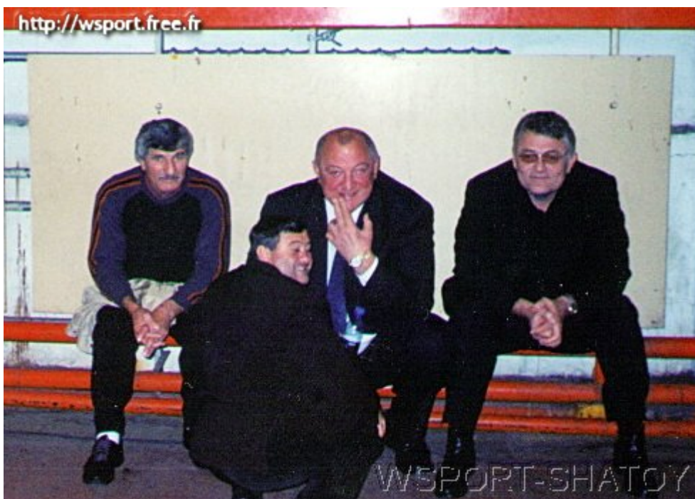
Известный чеченский тренер и борец Герберт Джабраилов, 2-кратный олимпийский чемпион и 4-кратный чемпион мира Сослан