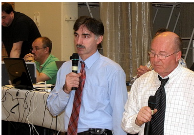
Организаторы турнира, руководство

В этот знаменательный день под сводами спортивного комплекса Воррикена собралось 156 борцов вольного стиля из 36-ти спортивных клубов восьми стран Европы для того, чтобы отдать дань уважения великому чеченскому спортсмену. Среди них не было случайных атлетов или новичков, все клубы старались послать своих лучших представителей. В подавляющем большинстве это были чемпионы и призеры региональных, национальных и международных юношеских и юниорских турниров.