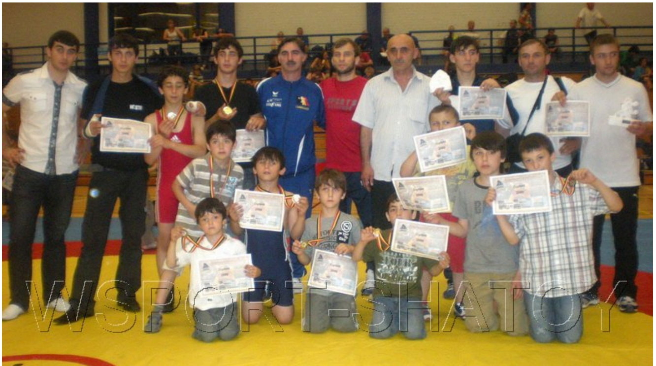
Группа чеченских тренеров и спортсменов после соревнований