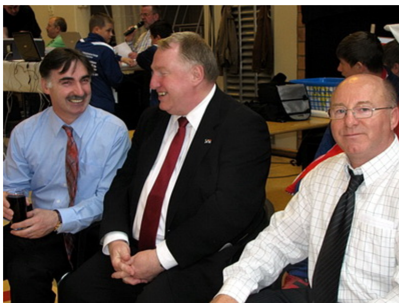
Иса Гамбулатов, Карл-Хайнц Ламберт, Арнольд Вауфф

Из приглашенных почетных гостей на турнир смог прибыть глава Восточной Бельгии, один из самых авторитетных политиков страны, являющийся первым претендентом на пост премьер-министра Бельгии, президент-министр Карл-Хайнц Ламберц.