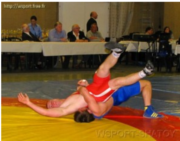
Чемпионы и призеры турнира