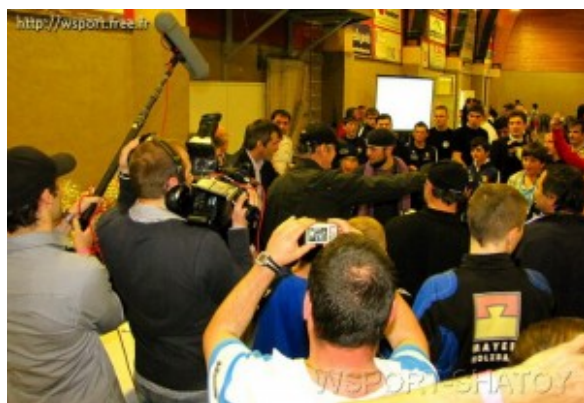
Бувайсар Сайтиев в центре внимания

завершения турнира. От желающих поздороваться с ним, сфотографироваться, взять автограф, просто подойти поближе и посмотреть, не было отбоя. Смертельно уставший Бувайсар (как потом выяснилось, из-за переездов он почти не спал трое суток) не отказывал во внимании никому – ни маленьким, ни взрослым. И в то же время не забывал наблюдать за соревнованиями.