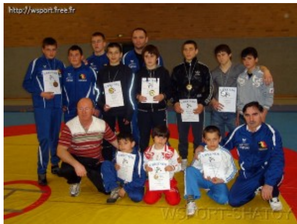
Команда «РАЕРЕН 2006» – победительница турнира