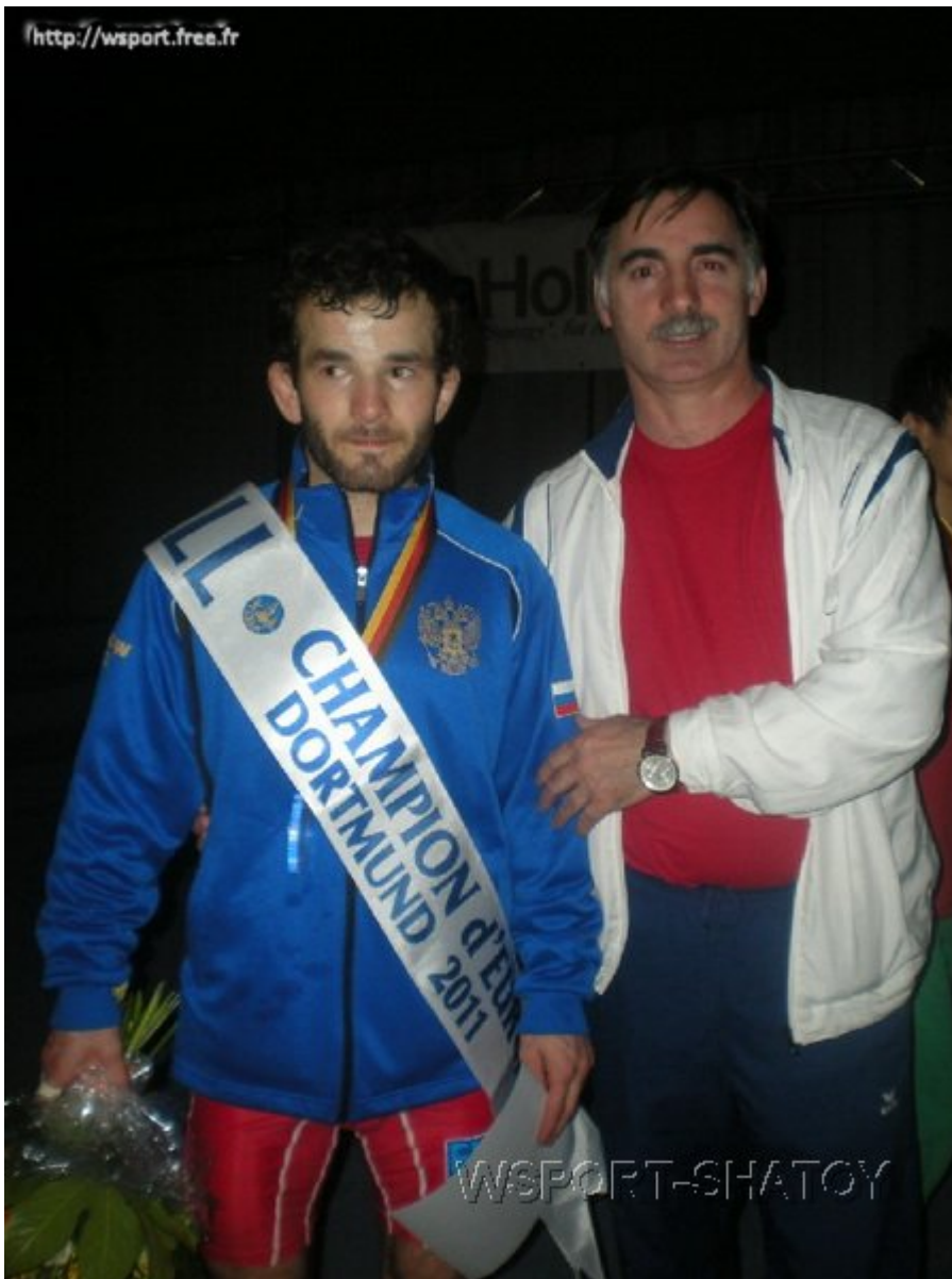
Чемпион Европы Джамал Отарсултанов