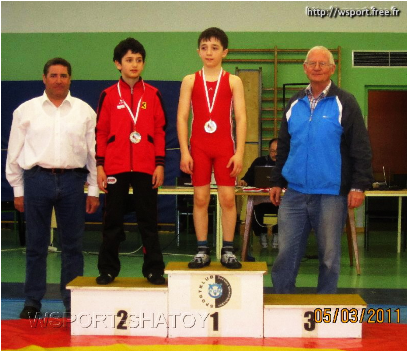
Чемпион Абхан Хакимов