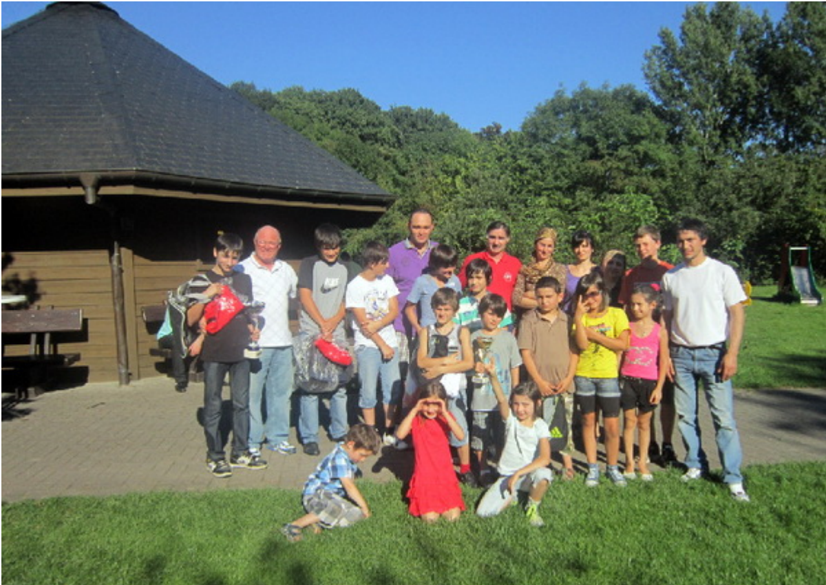
Спортсмены, их родственники, тренеры после награждения