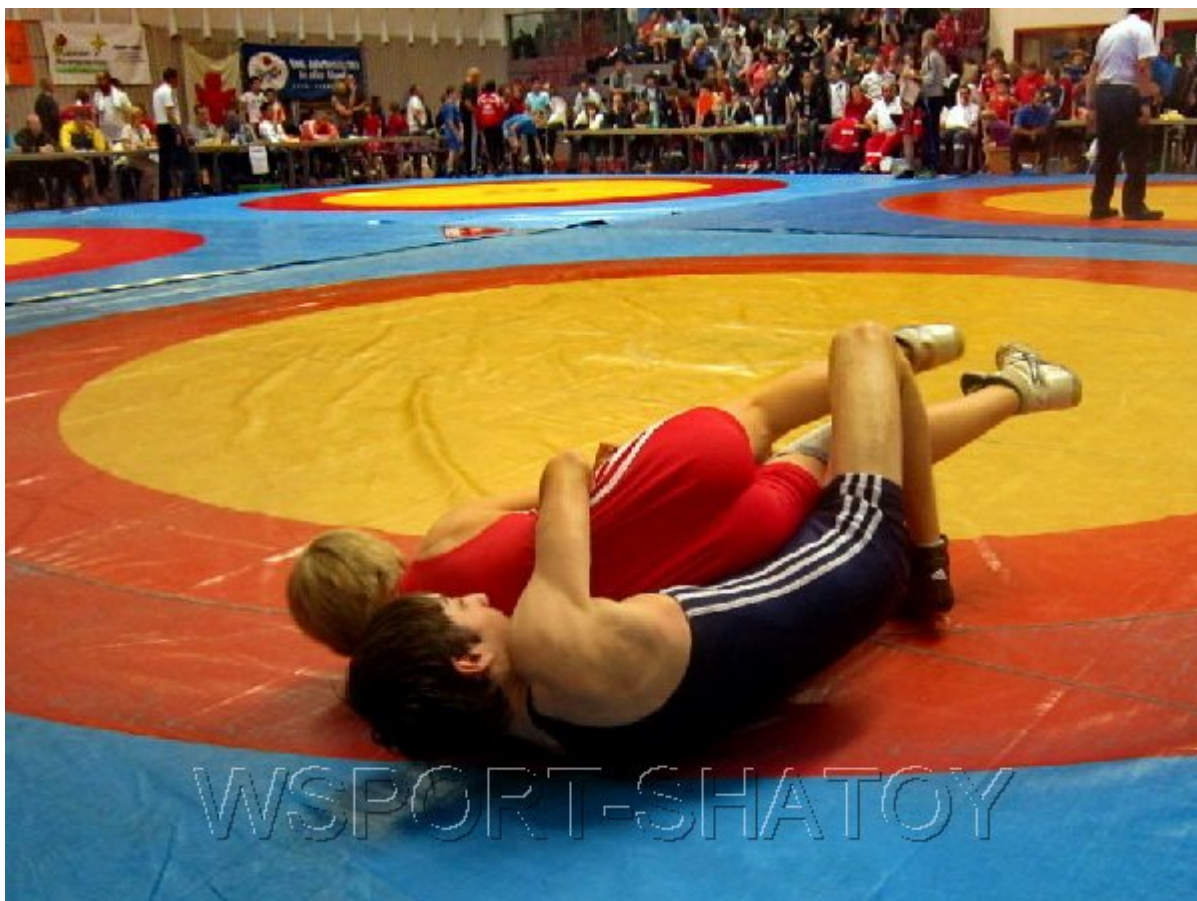
Джохар проводит накат