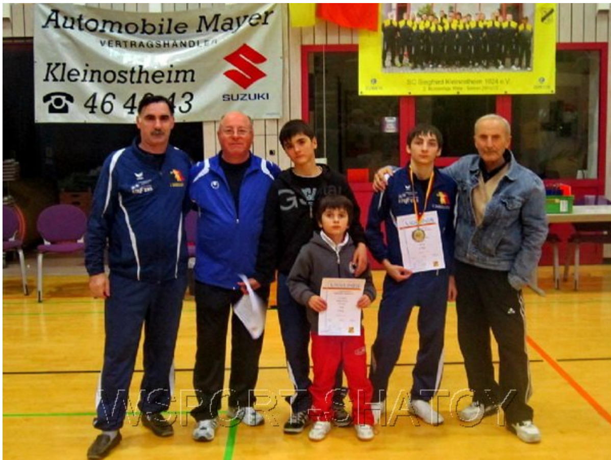
Команда "Раерен 2006" (Бельгия) на турнире.