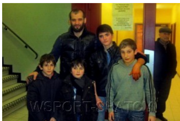
Адам Сайтиев с юными чеченскими спортсменами из Бельгии

Адам приехал в Раерен и провел тренировку. Безусловно, это был праздничный вечер для наших юных спортсменов. А бельгийские специалисты спортивной борьбы внимательно наблюдали за действиями опытного спортсмена и тренера.