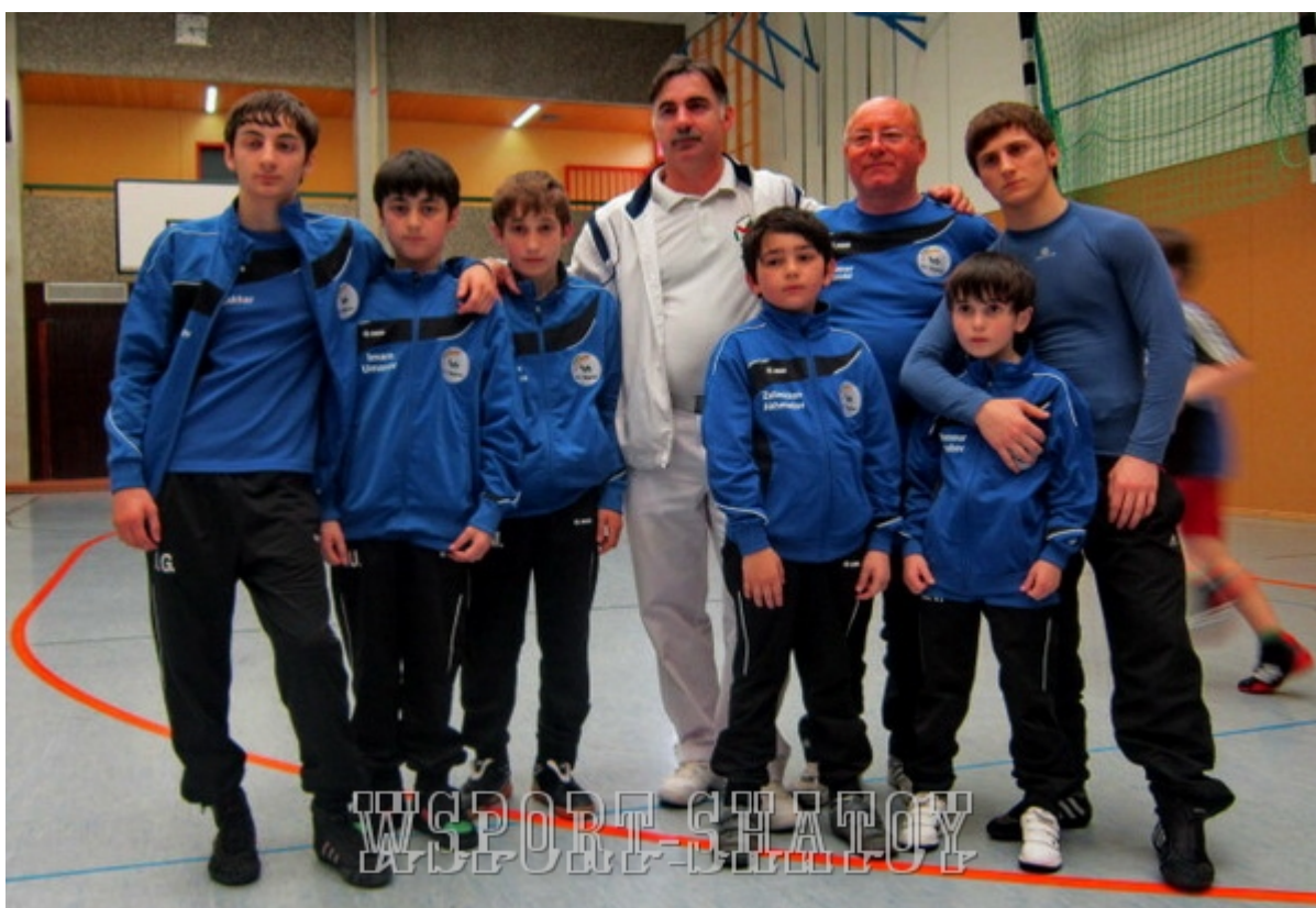
Команда спортклуба "Раерен 2006" из Бельгии