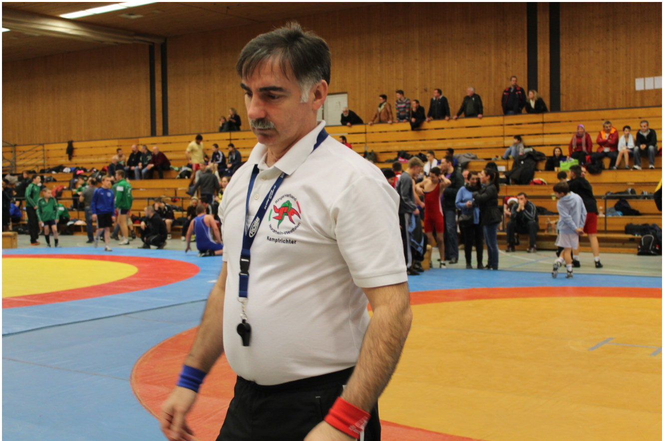
Судья Иса Гамбулатов