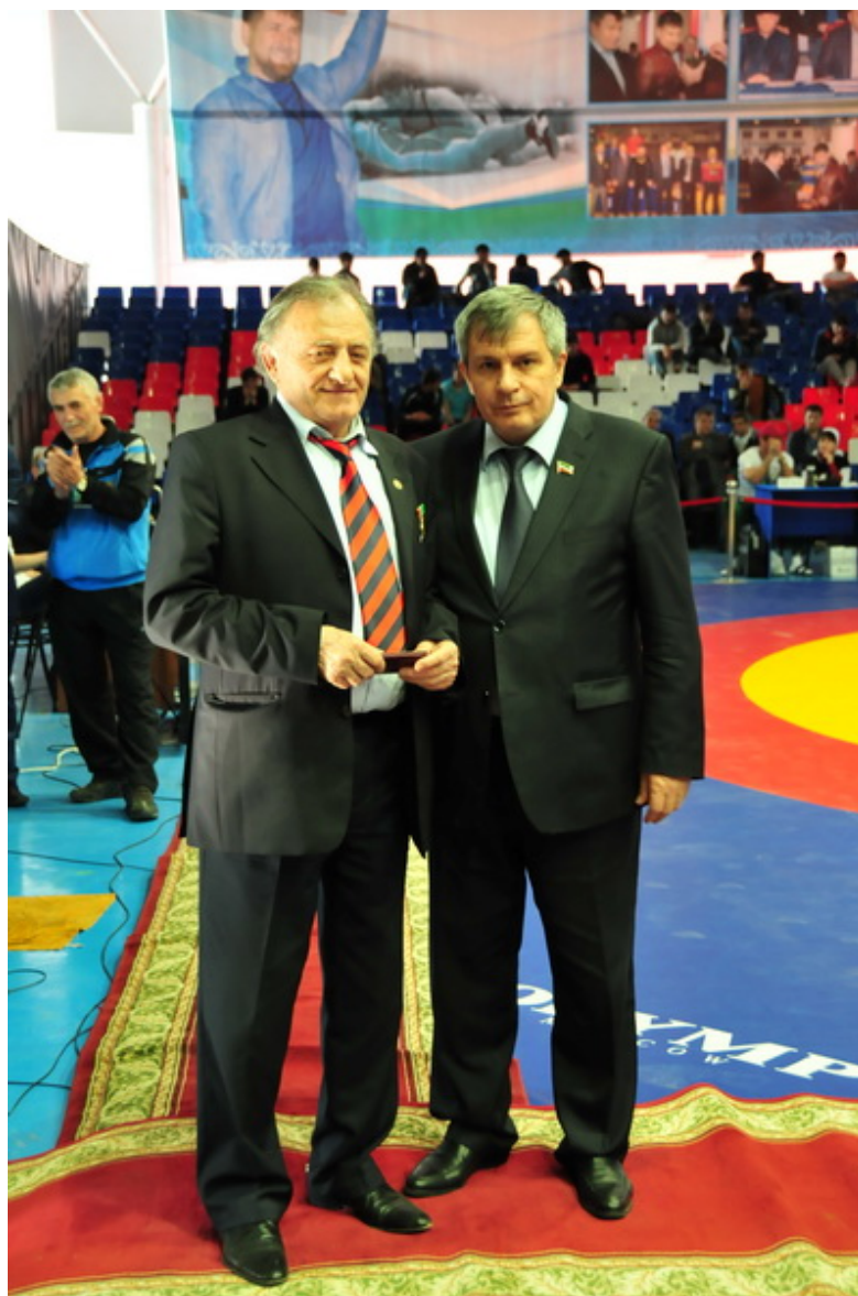
На Парламентском турнире-2013.