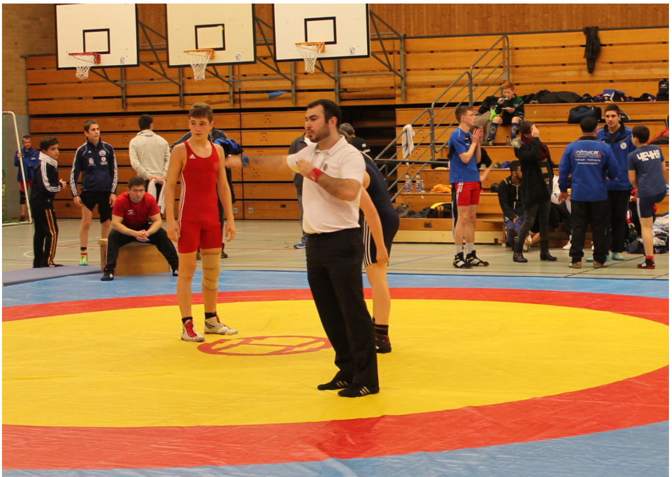
Судья Рустам Исаев