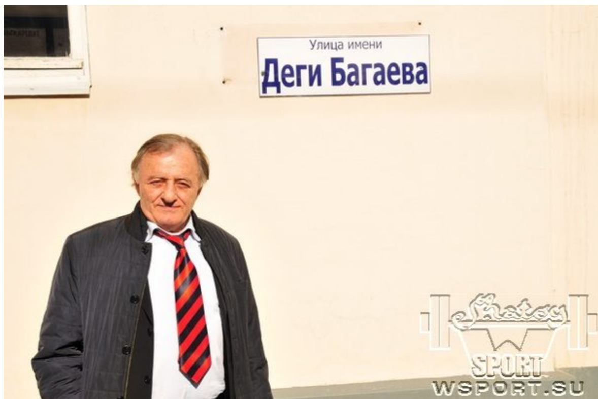
На улице им.Дэги Багаева, 2013г.