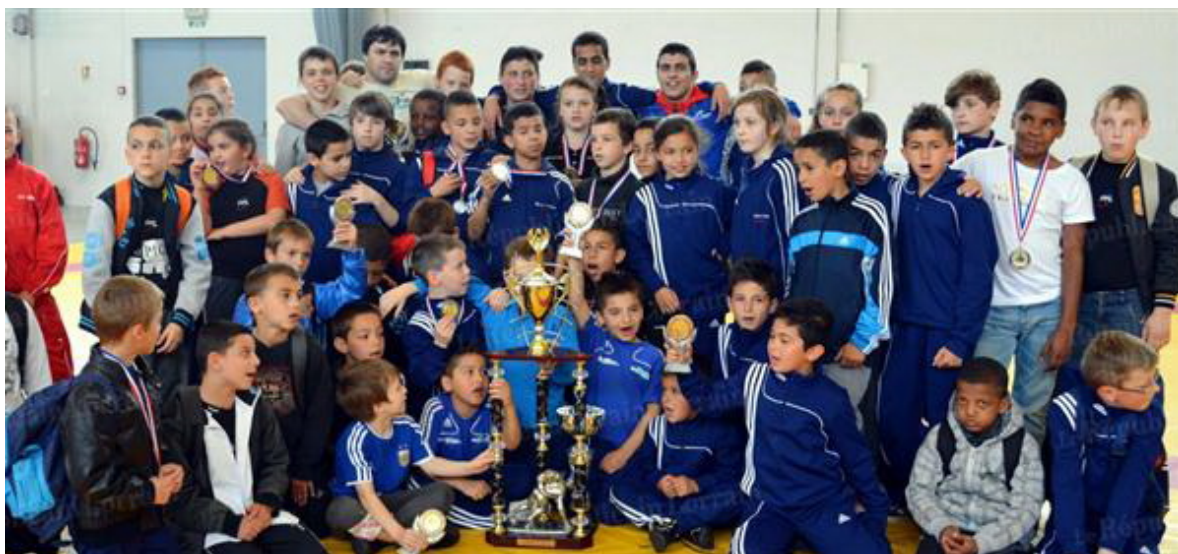
Команда г.Шильтигейм после турнира