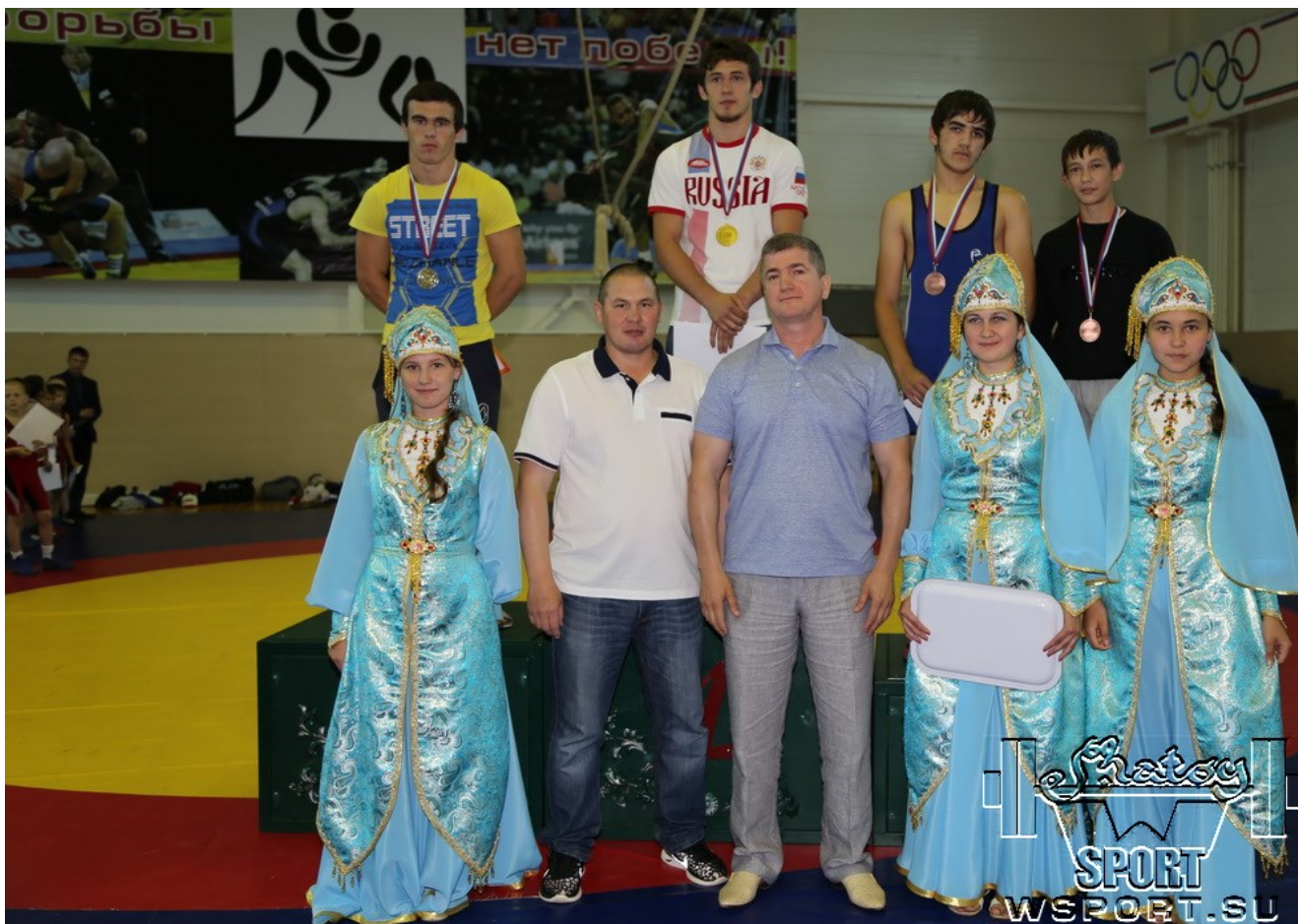
Награждение призеров III-го Всероссийского турнира "Дружба"