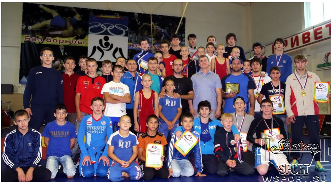
Команды Чувашии и Чечни