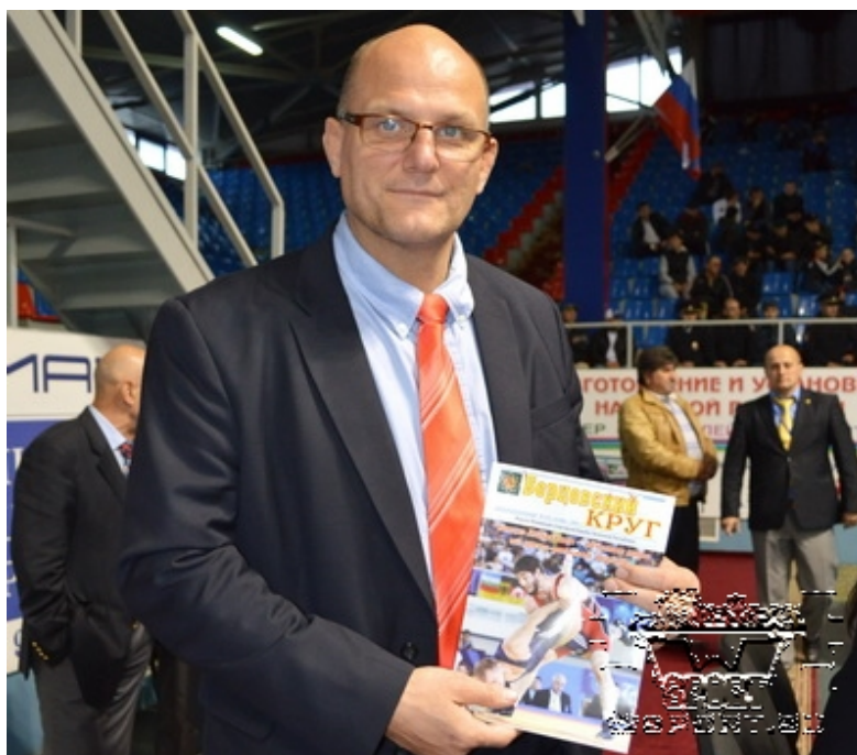
Анжей Вронски с журналом «Борцовский Круг».

18-19 октября в Хасавюрте проходил VI Межконтинентальный Кубок по вольной борьбе, посвященный знаменитым спортсменам XIX-XX веков. 170 борцов из 13 стран мира спорили за комплекты наград в восьми весовых категориях. А техническим делегатом от Международной Федерации был 2-кратный олимпийский чемпион по греко-римской борьбе из Польши Анжей Вронский. На турнир заглянули Глава Республики Дагестан Рамазан Абдулатипов и председатель правительства Республики Дагестан Абдусамад Гамидов.