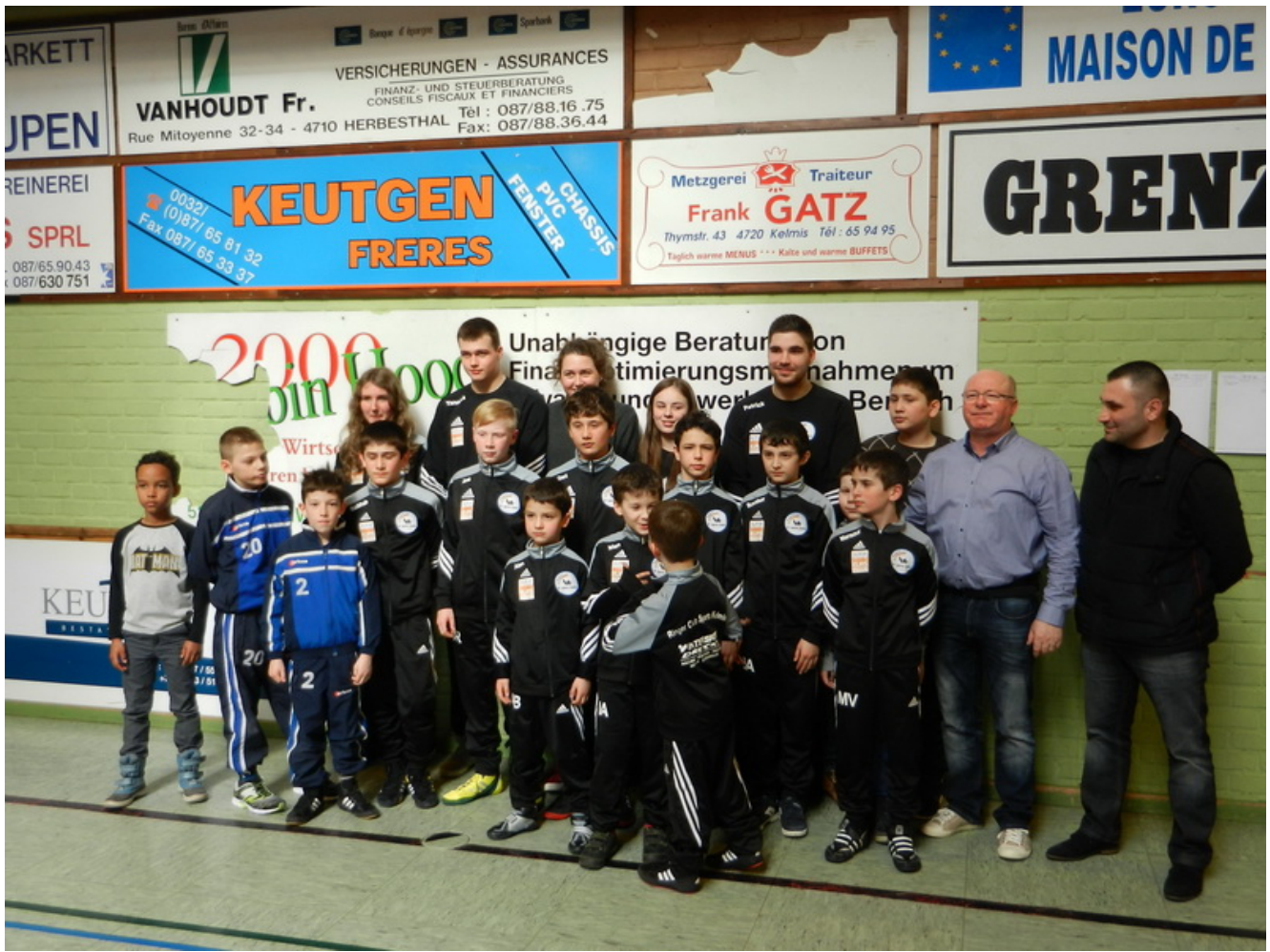
Группа участников соревнований