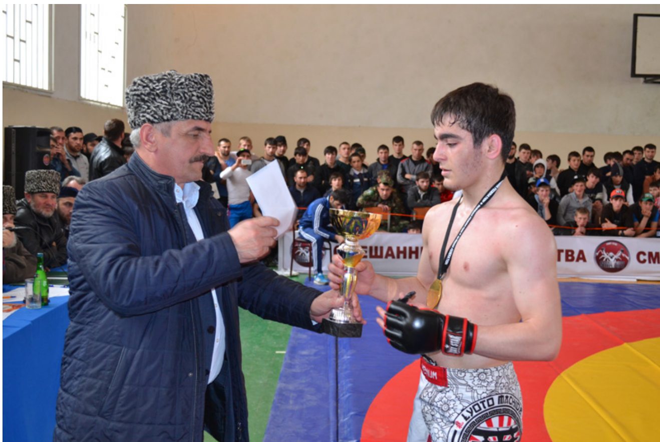
Награждение проводит Глава Шатойского района Шадид Чабагаев