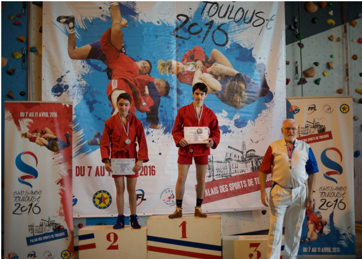
Расул Кэро в 4-й раз становится чемпионом Франции по