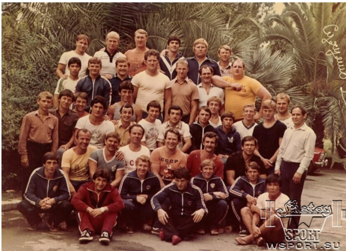
Хасан Баиев в сборной СССР