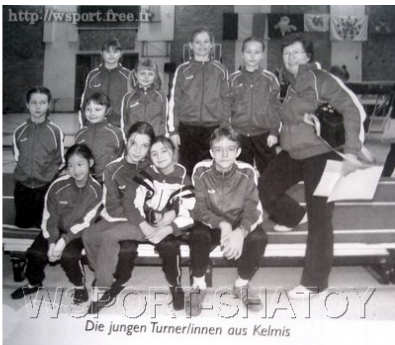
Die jungen Turnerinnen aus Kelmis