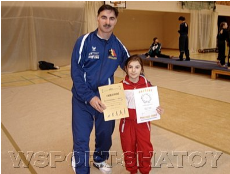
Папа - лучший болельщик