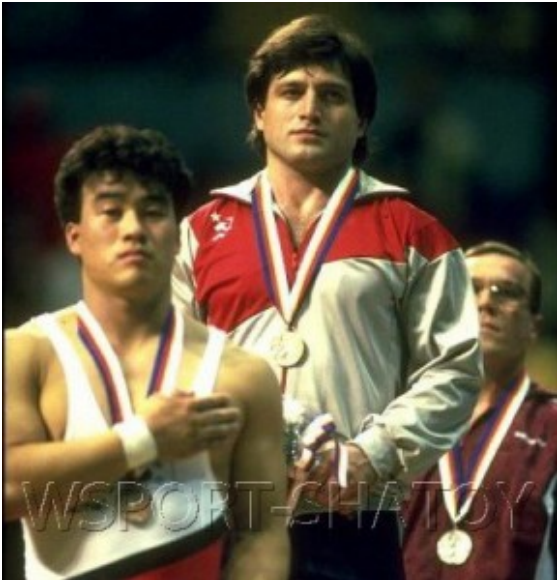
Исраил Арсамаков на высшей ступеньке пьедестала почета Олимпийских Игр 1988 года в Сеуле

Он переквалифицировался, в хорошем смысле этого слова, в философа и культуролога. Вот уже который год он настойчиво двигает идею Фестиваля национальных видов спорта и народного творчества «Кавказские Игры». Он многих сумел убедить и кое-чего уже добился. Идея поддержана министерствами спорта и культуры России, Оргкомитетом «Сочи-2014», руководством Ингушетии. В прошлом году, с марта по июль, в республике не утихали страсти, связанные с фестивалем. Более 20 тысяч жителей Ингушетии участвовали на соревнованиях по традиционным (древним) видам спорта, в других мероприятиях, где демонстрировались достижения народных умельцев. Самое интересное, что в этот период резко снизилась активность боевиков и вообще всякая уголовщина. Народ, и стар и млад, с энтузиазмом включился в фестиваль.