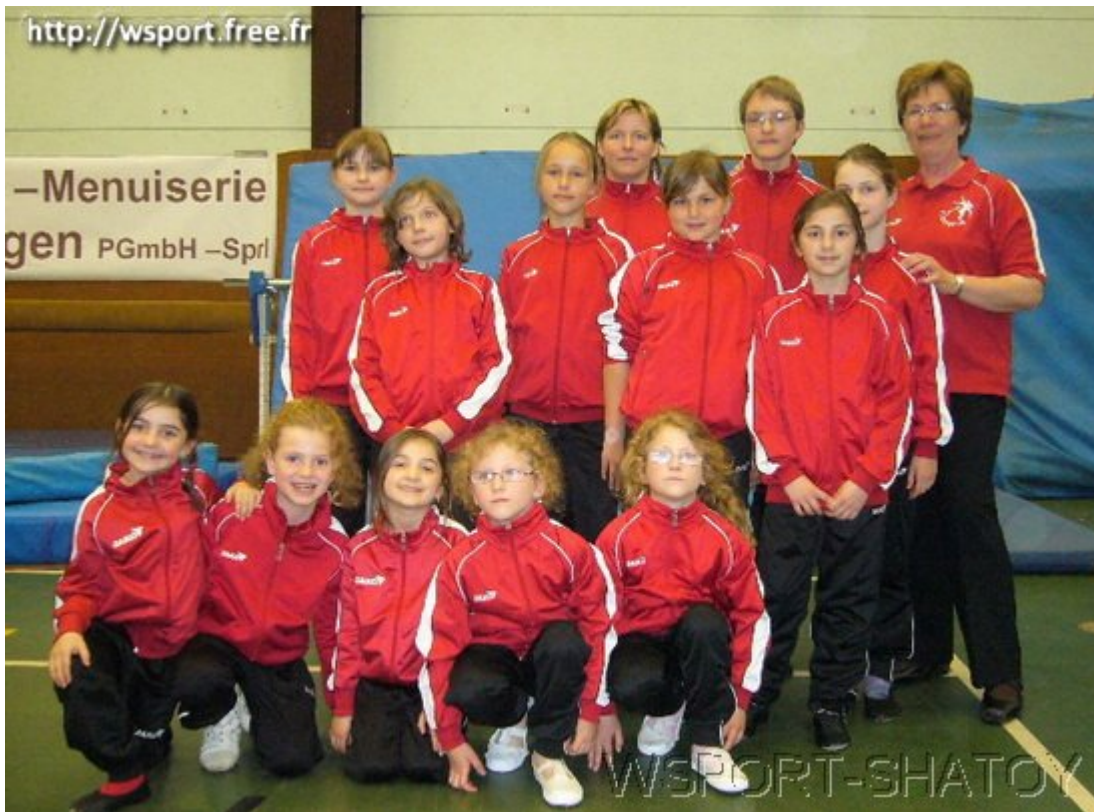
Команда спортклуба "Келмис"