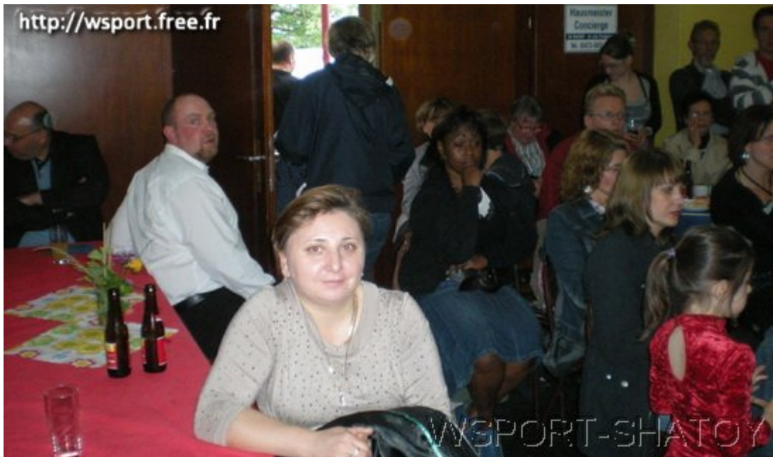
Мама переживает за девочек