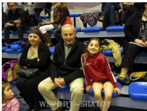
Мама и дед пришли поболеть