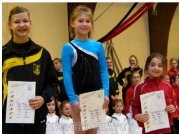
Раяна на третьем месте