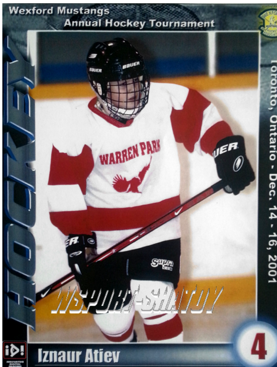
Изнаур Атиев на страницах канадского журнала «Хоккей», декабрь 2001г.

Насколько популярны эти клубы в стране, провинции? Какие имеют достижения?