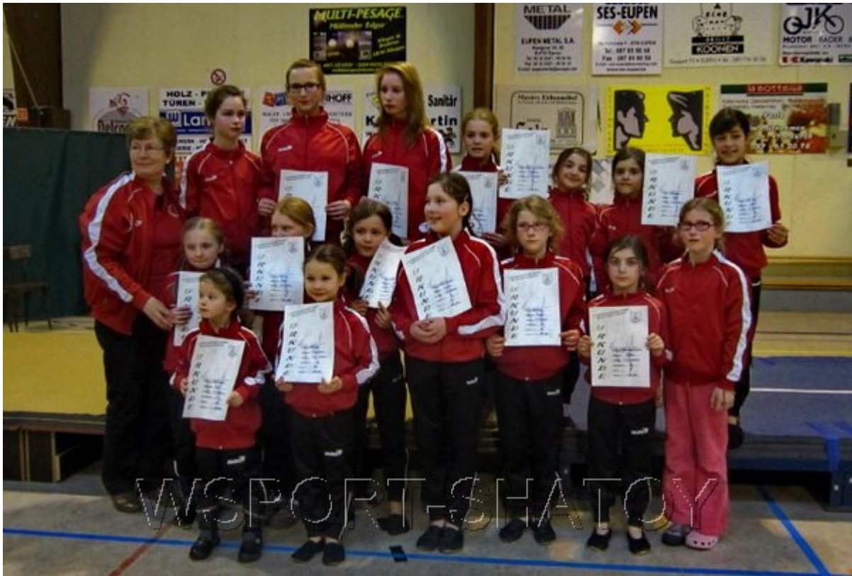
Команда гимнастического клуба Келмис