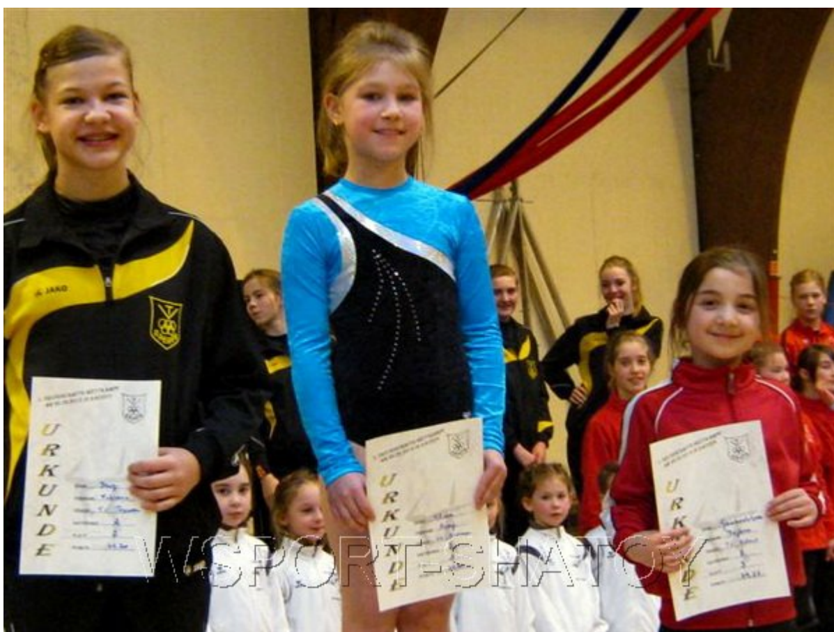
Раяна на третьем месте