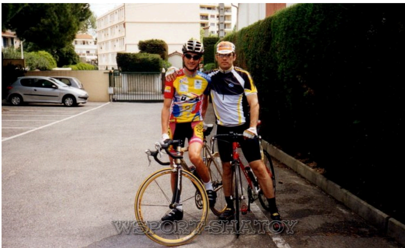
С чемпионом Франции Винсентом Жае.