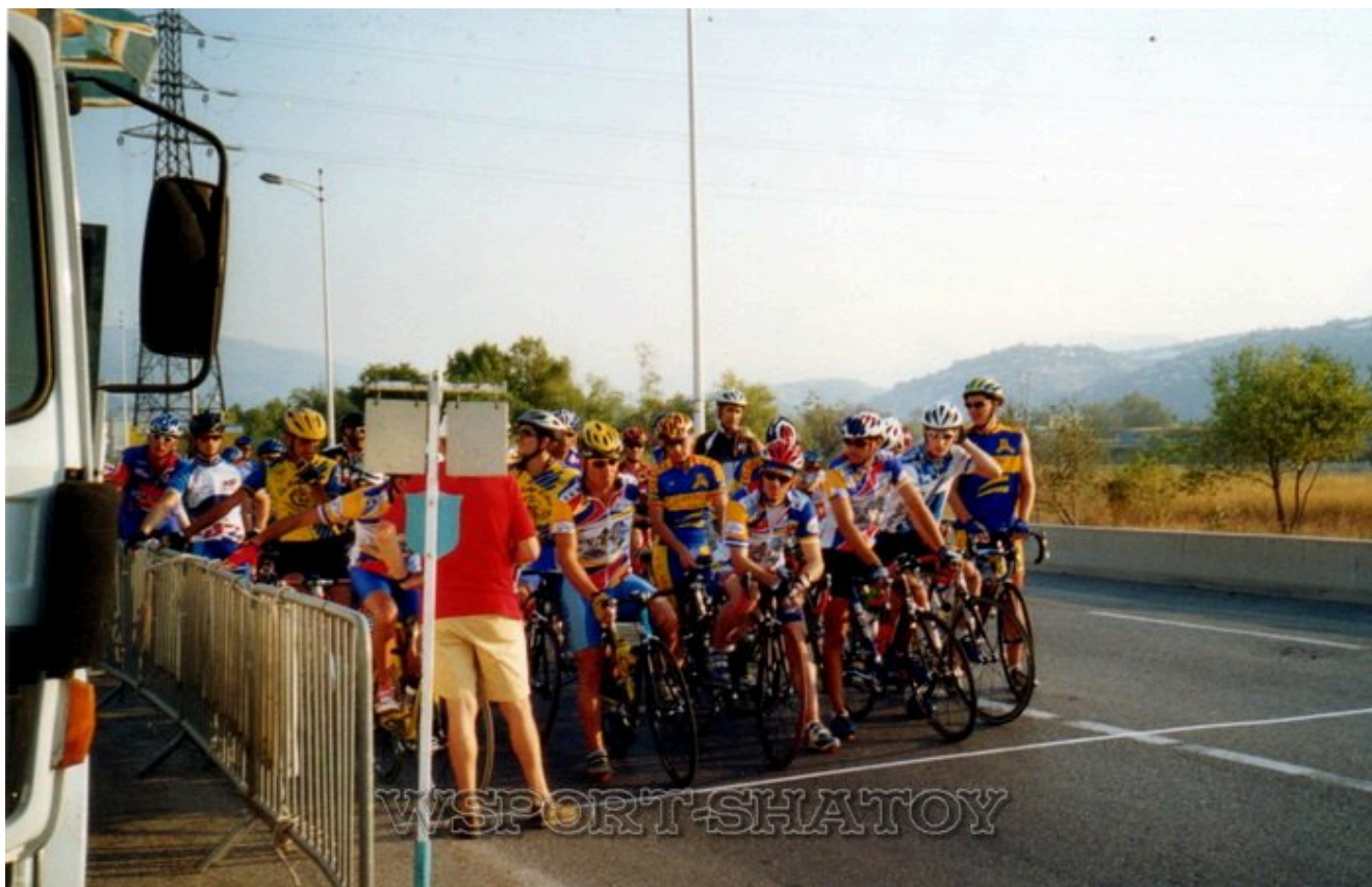
Чемпионат Юга Франции, 2004г.