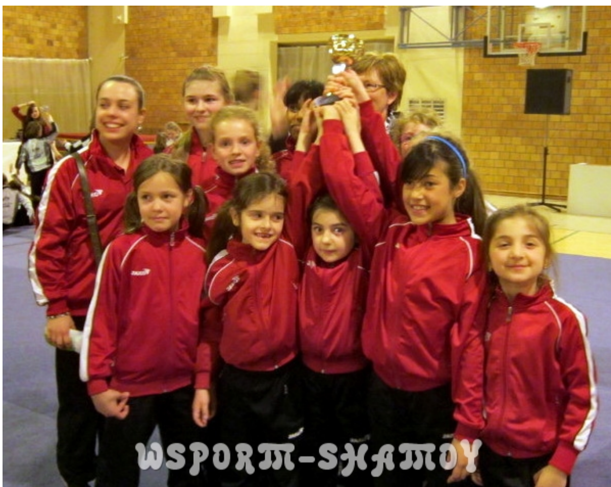
Команда спортклуба "Келмис" - чемпион турнира