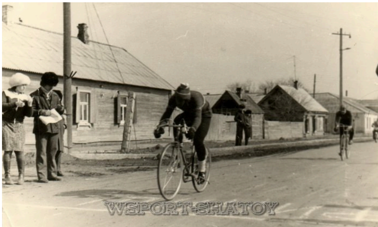
Чемпионат Астраханской области, 1978г.

Победитель и призёр чемпионатов юга Франции (2003-2008гг.).