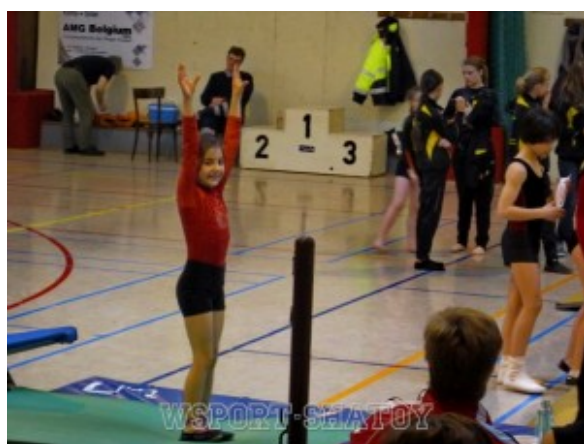
Раяна выполняет упражнение