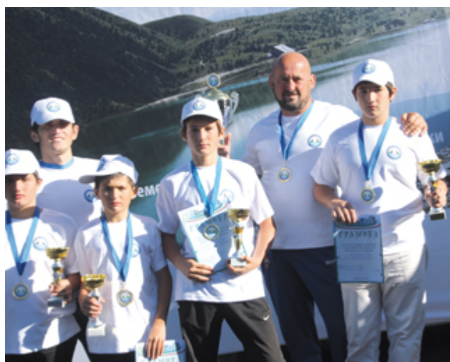
После заплыва на Кезеной-Ам