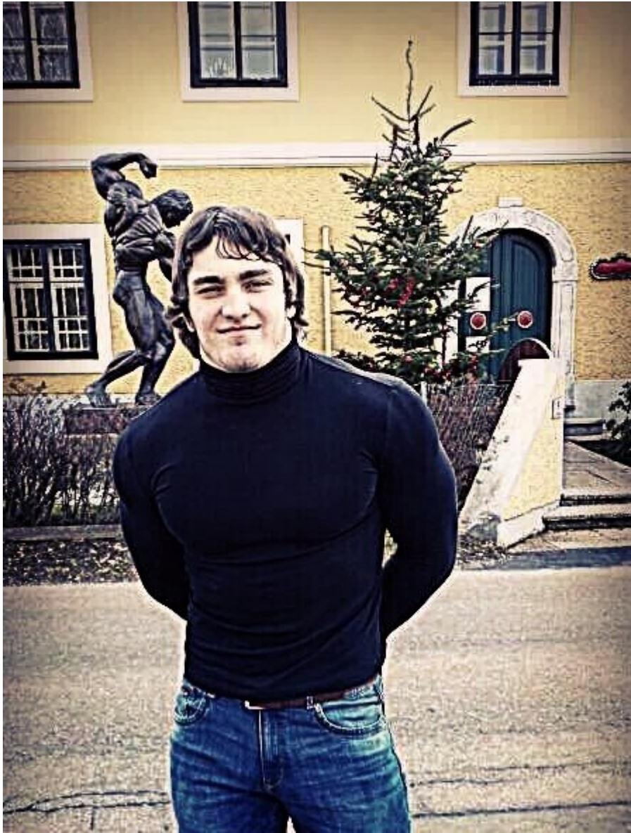
В деревне Таль в Австрии около дома Арнольда Шварценеггера