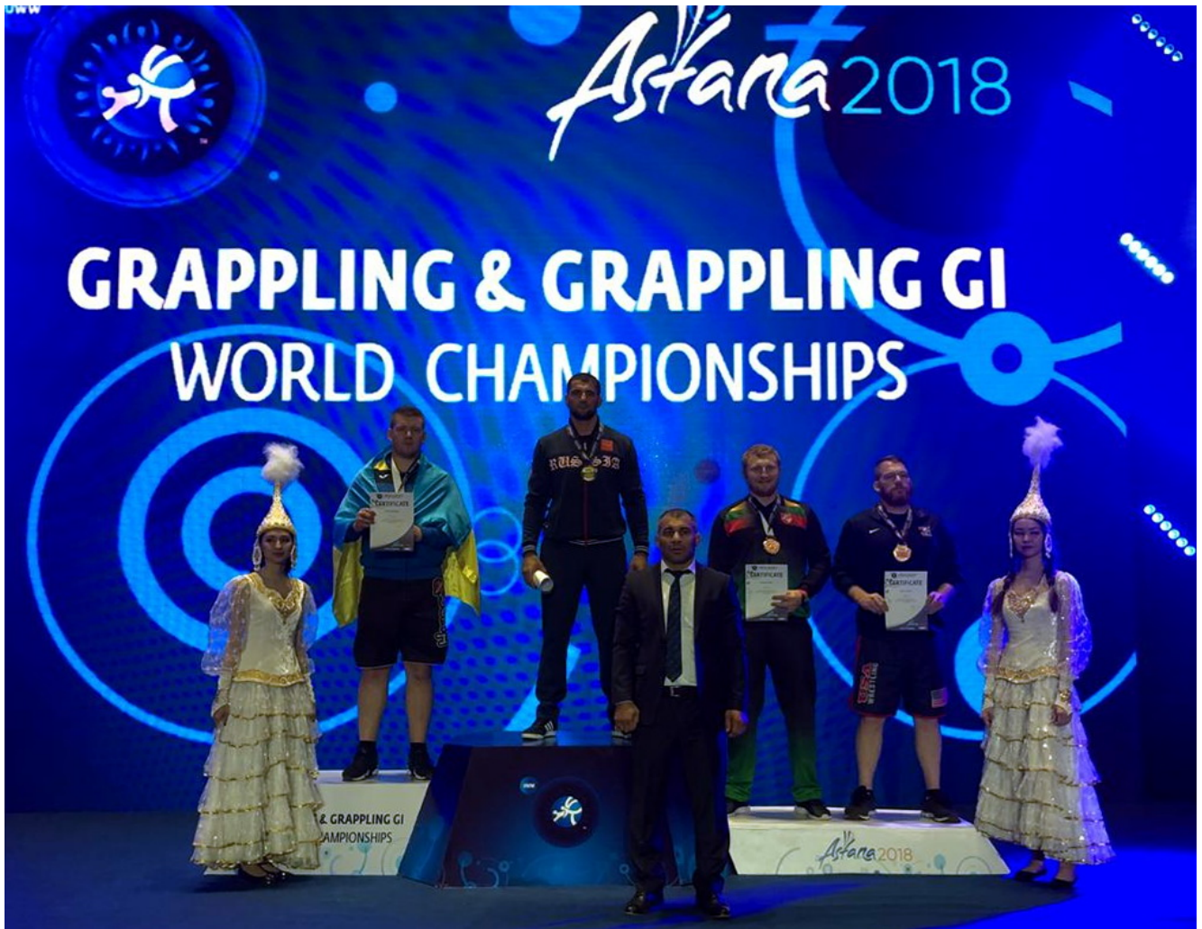
Хамзат Стамбулов - чемпион мира-18