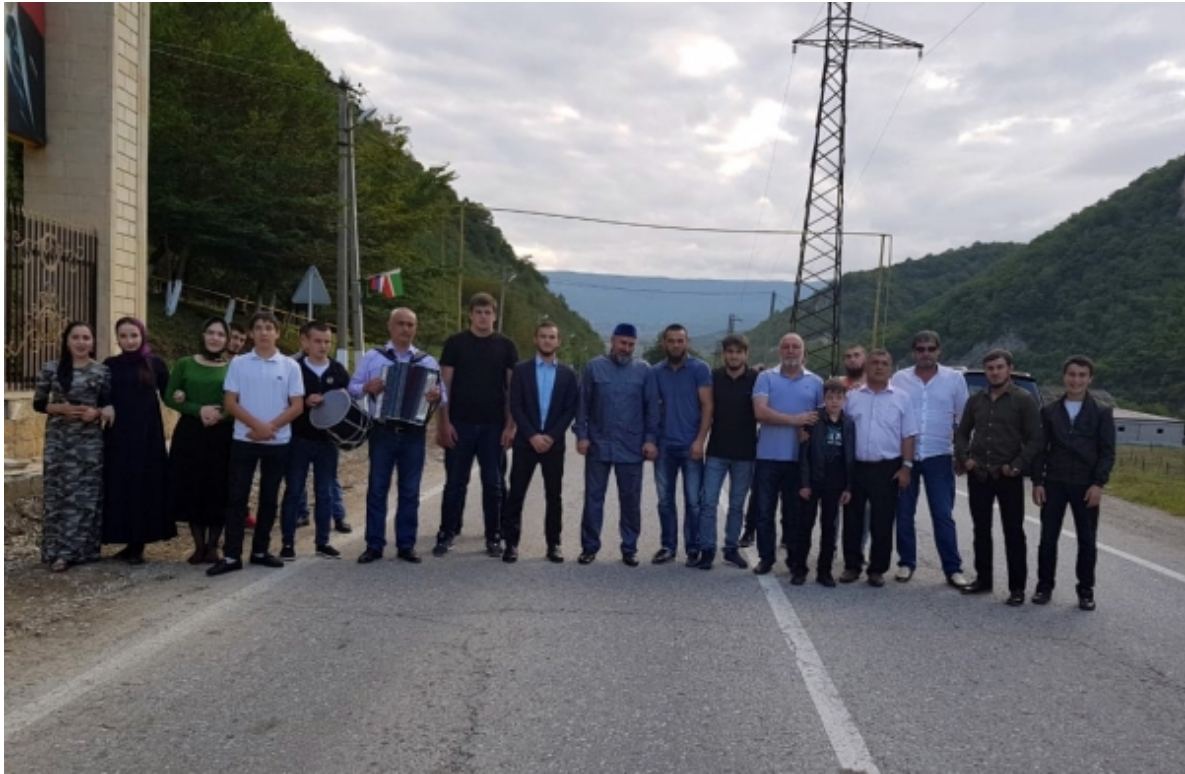
Встреча чемпионов мира в Шатое