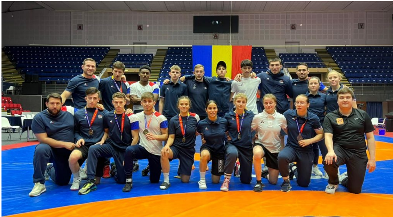
Команда Франции в Румынии