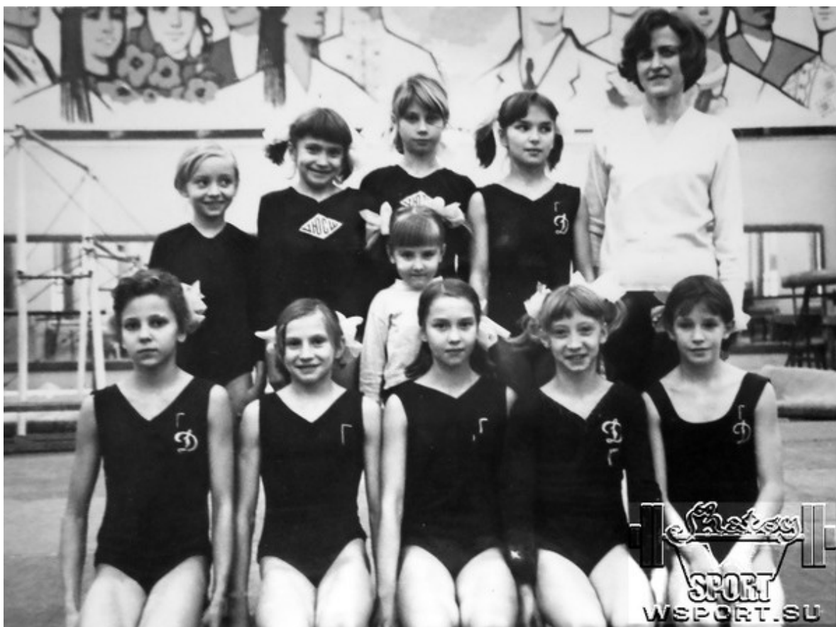
Грозненские гимнастки начала 70-х