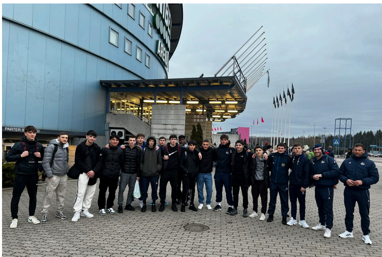
Борцы из Франции в Таллине

Интересно, что в командном зачете первые четыре места заняли американские и украинские команды. Но американцы брали количеством. Так, на 1-е место вышла сборная США в составе которой было 98 борцов. На 2-м месте национальная сборная Украина, которая насчитывала 20 спортсменов. На 3-м американская команда «Апекс + Топ тим» состоящая из 38 спортсменов. На 4-м вторая сборная Украина, включавшая 28 борцов.