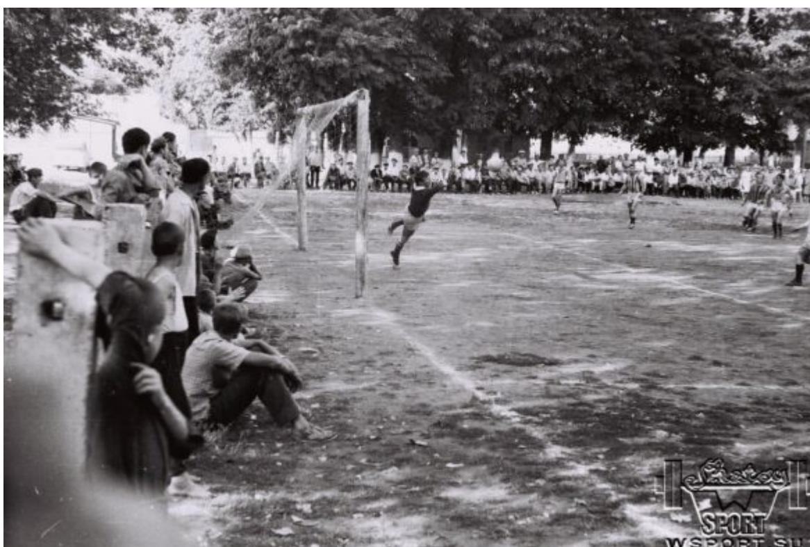
Матчи чемпионата ЧИАССР в с.Советском (Шатое)

В 1965 году, в 8-м классе, я почти регулярно играл за взрослую команду Советского района. Обязательно забивал гол, они меня хвалили и это меня – юношу сильно мотивировало. В 1966 году был чемпионат республики, играли в Первомайском и когда до конца игры оставалось где-то 20 минут меня выпустили на поле и