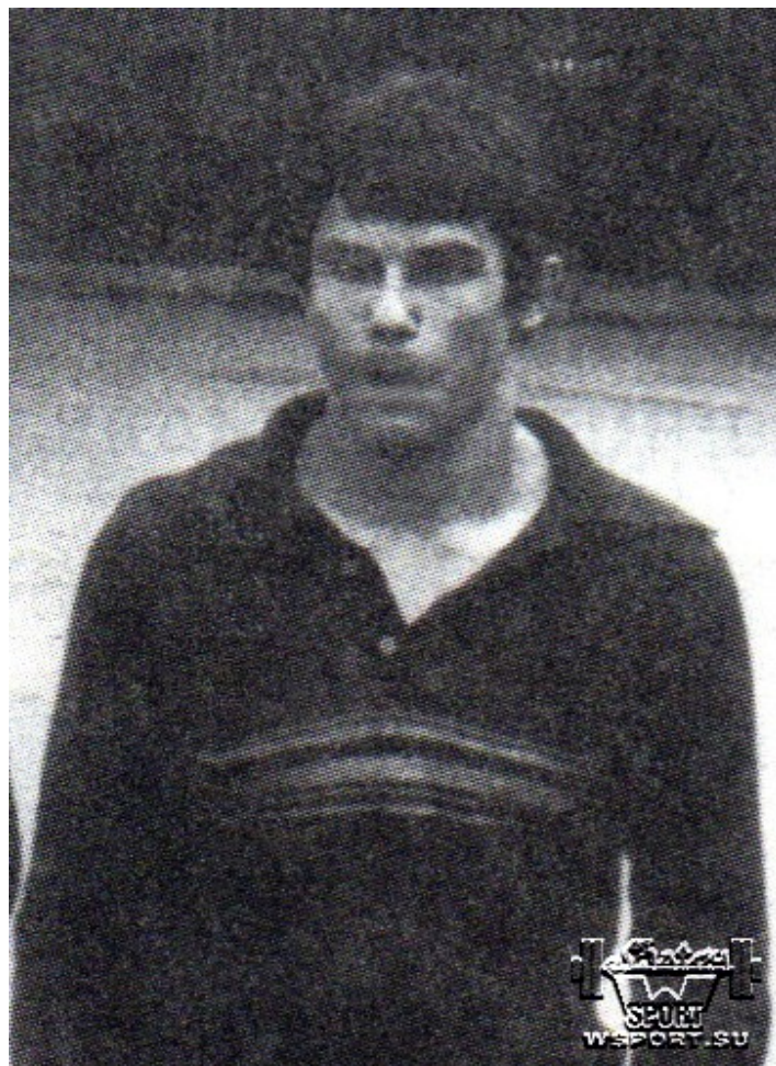
Таус Мазаев в середине 70-х.