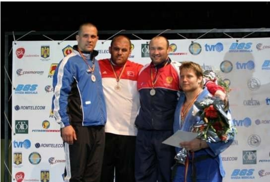
Чемпионат - 2004. Призеры в тяжелом весе.