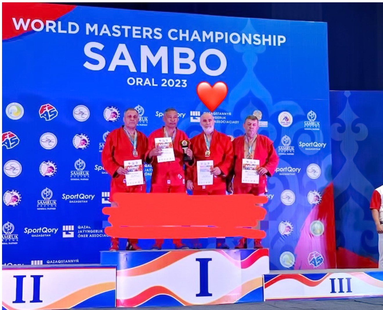
Бронзовый призер чемпионата мира по самбо Зайнди Абубакаров