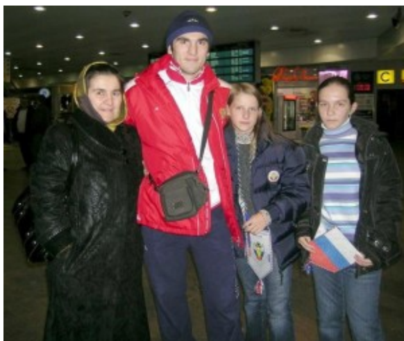
В аэропорту Шереметьево Артура встречают родные и болельщицы.

Как-бы то ни было, поздравим Артура Бетербиева с серебряной медалью чемпионата мира и пожелаем удачной подготовки к Олимпийским Играм – 2008.