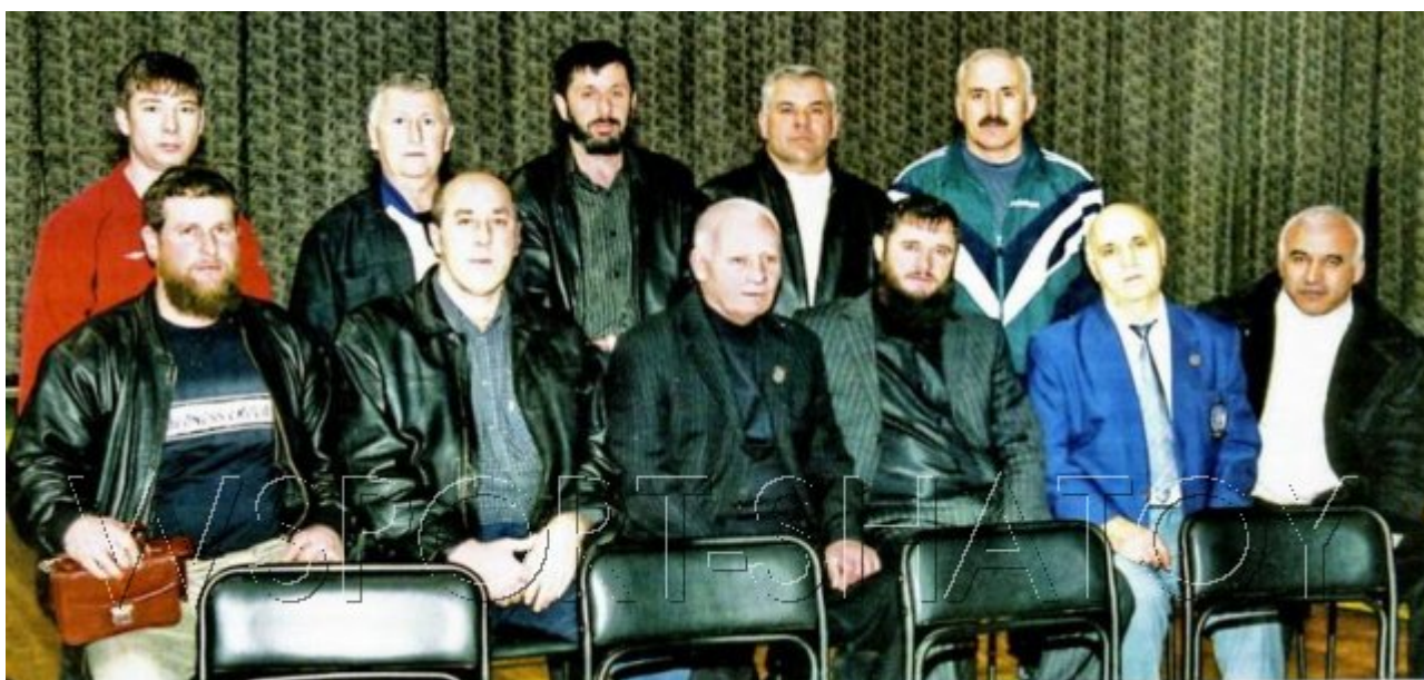
2006 год, Невинномысск, турнир Кадырова-Чемеркина. Эли стои второй слева.