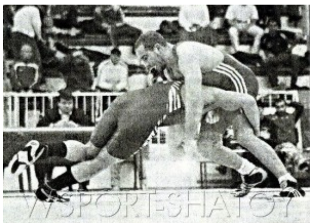
La 33 e édition du Challenge Deglane tient toutes ses promesses.

Однако, его тренер Фанель Карп совсем не расстроился: «В данный момент он набрал только 40% своей формы. Он может без проблем стать чемпионом Франции».