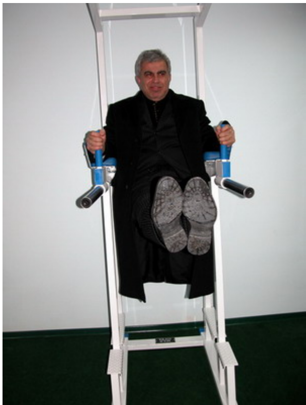
Министр держит "угол"