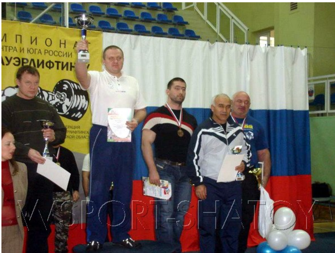
Команда Чечни на третьем месте