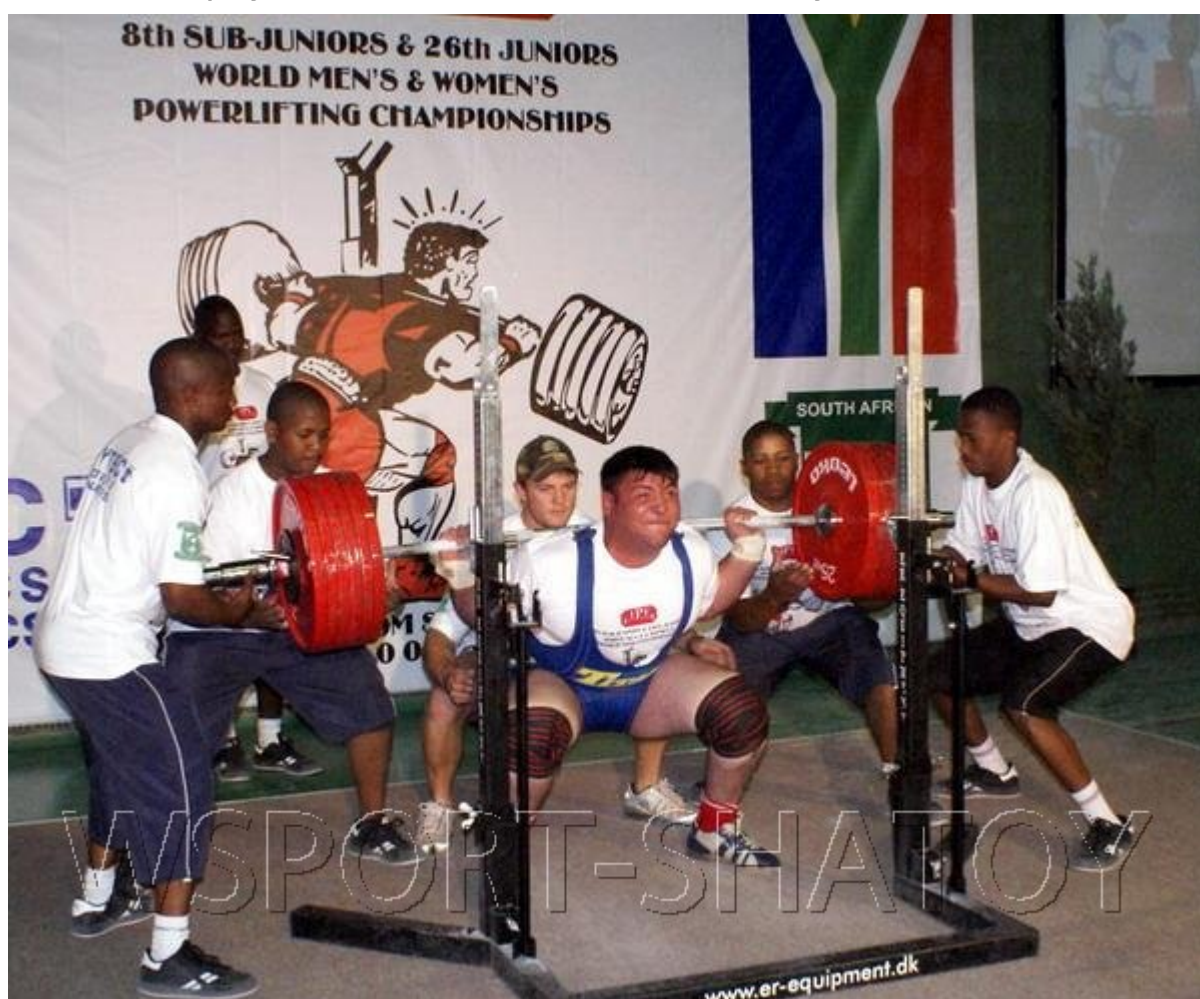
Есть мировой рекорд!