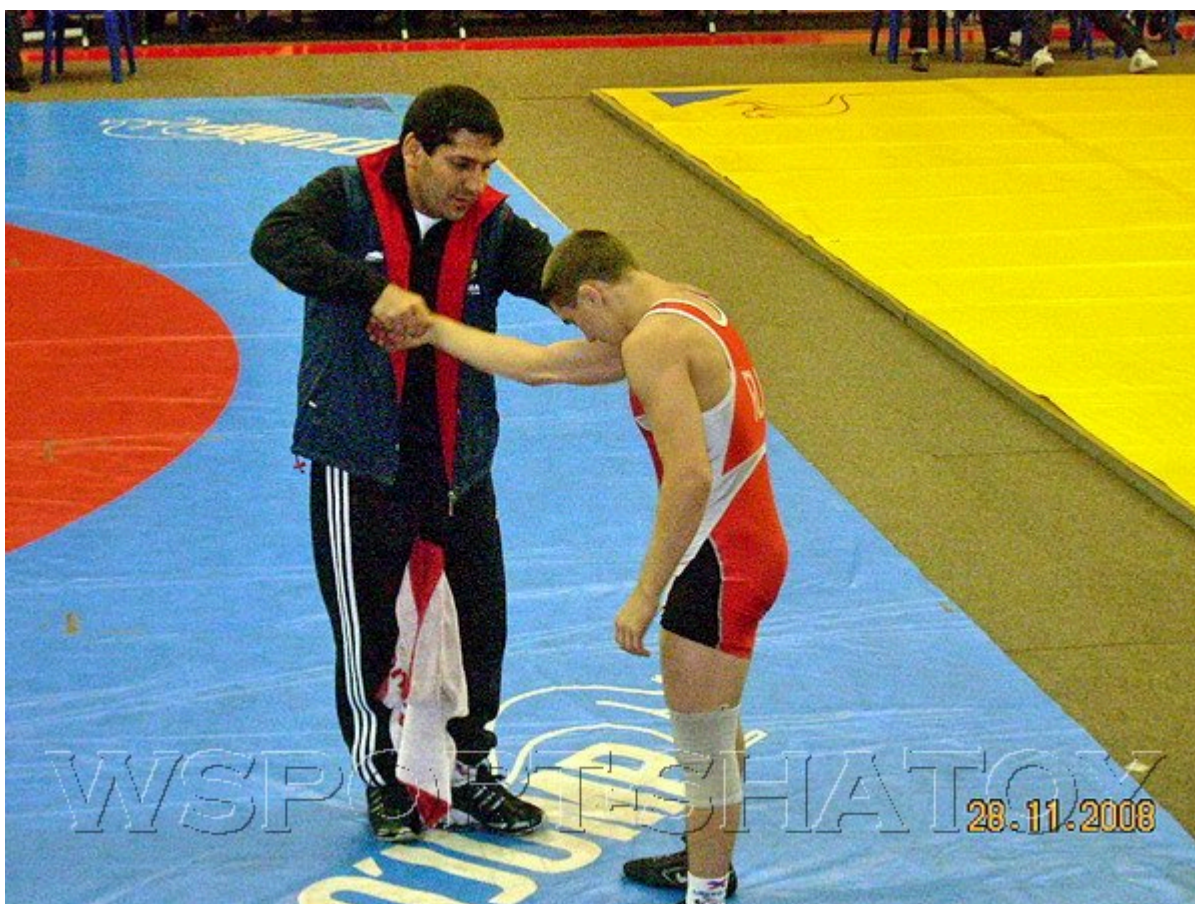
Знаменитый чеченский борец греко-римского стиля, 4-кратный чемпион мира, серебряный призер Олимпийских Игр-92 Ислам Дугучиев работает ныне тренером сборной России