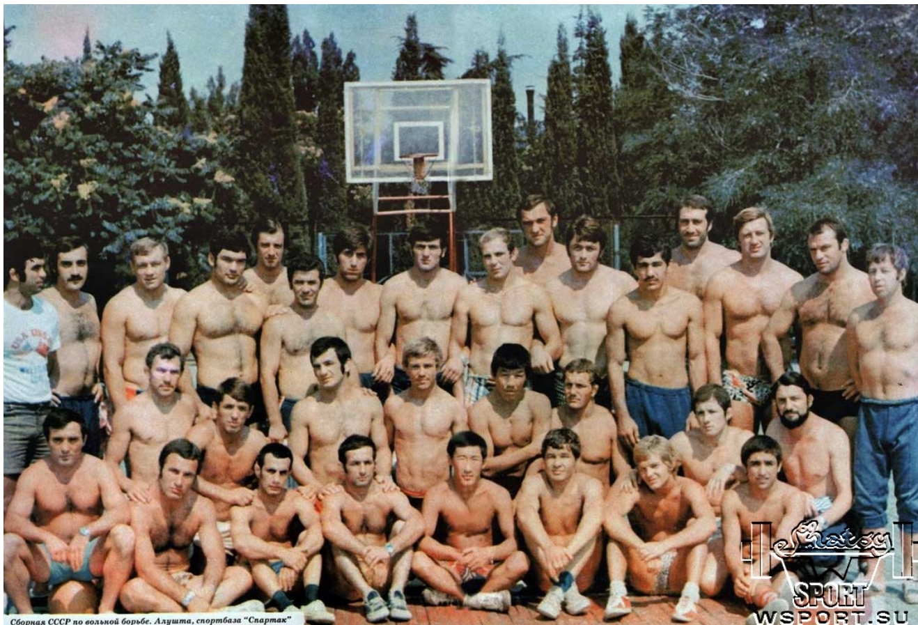
Сборная СССР по вольной борьбе. Алушта, спортбаза "Спартак"