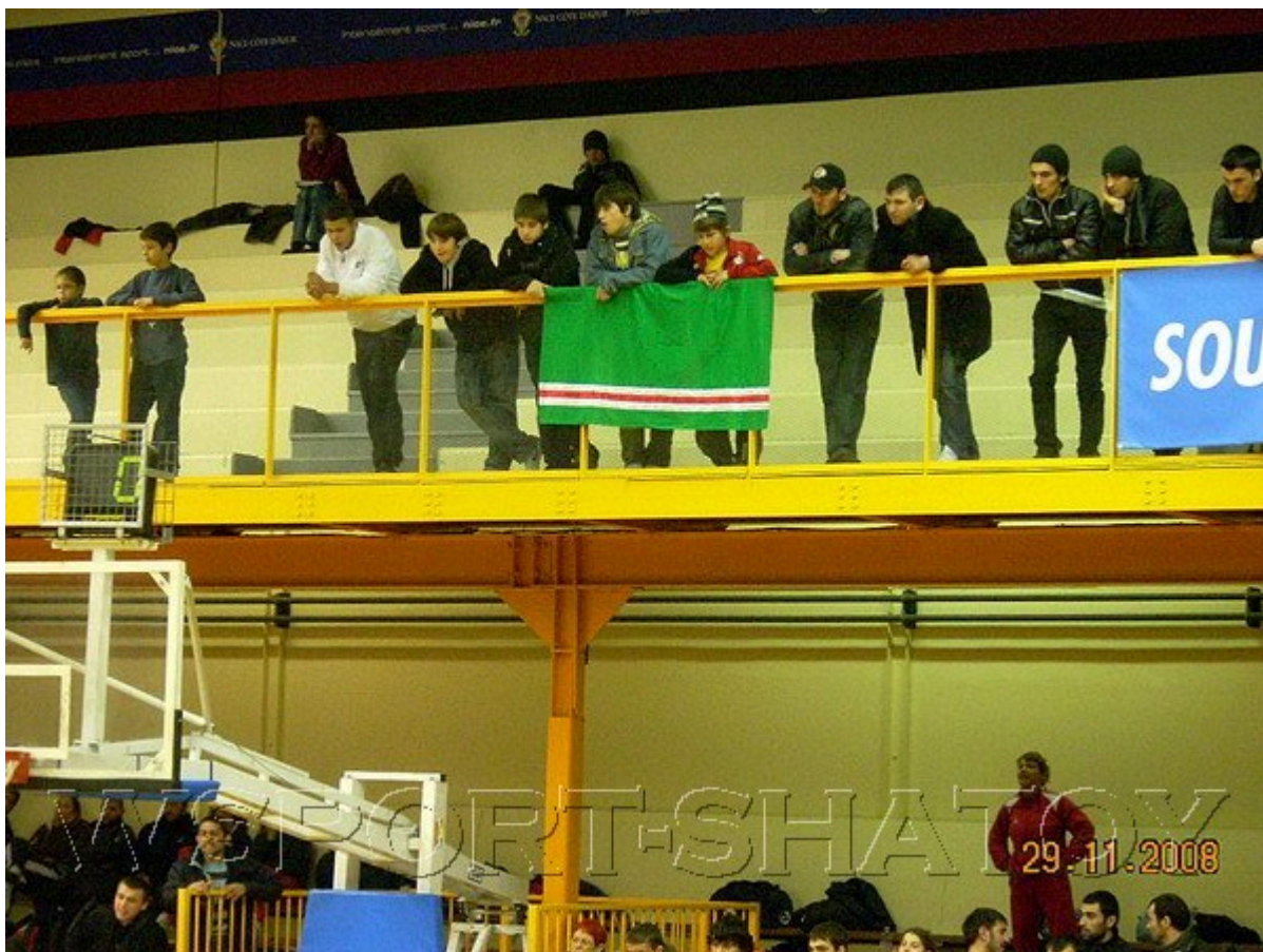
Чеченский флаг на трибуне