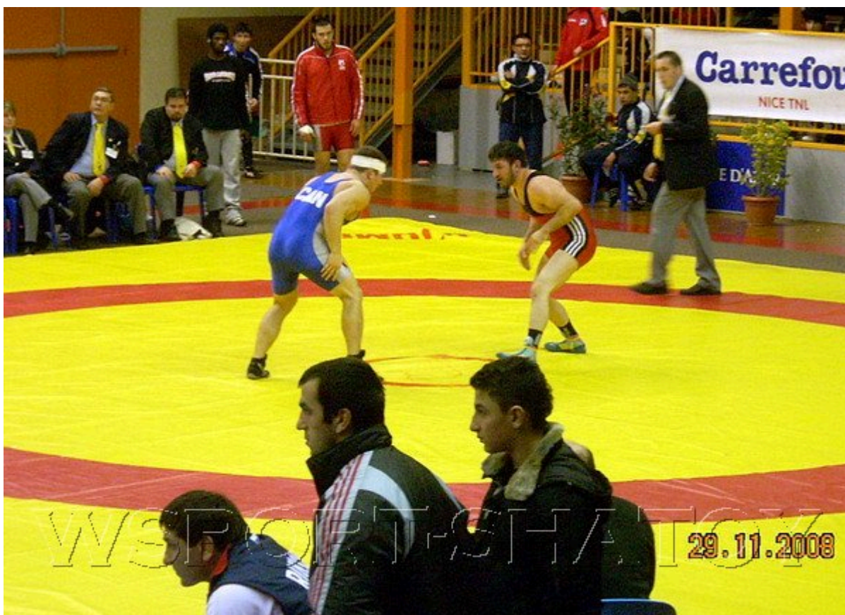
Арсен Саидов против Брауна Териотта из Канады