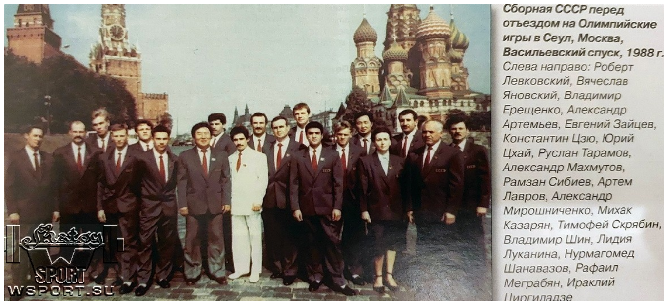
Сборная СССР перед отъездом на Олимпийские игры в Сеул, Москва, Васильевский спуск, 1988 г.

На профессиональном ринге провел 8 боев, во всех победил, из них 5 из них нокаутом.