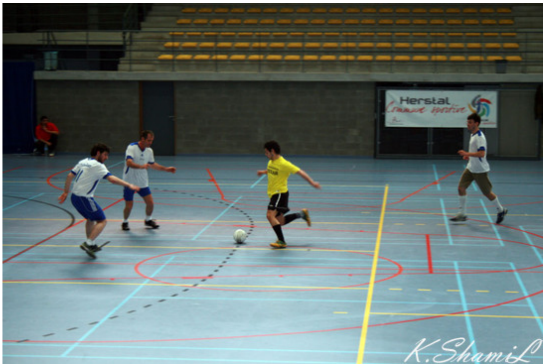
Иду на прорыв