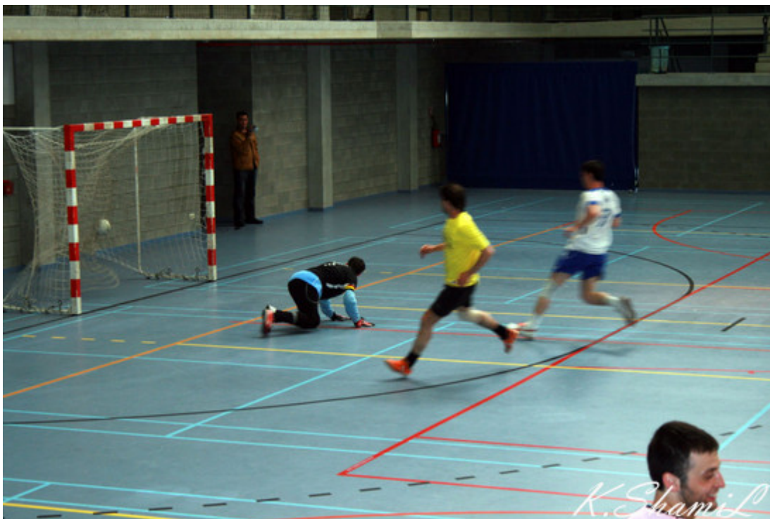
Мяч в воротах