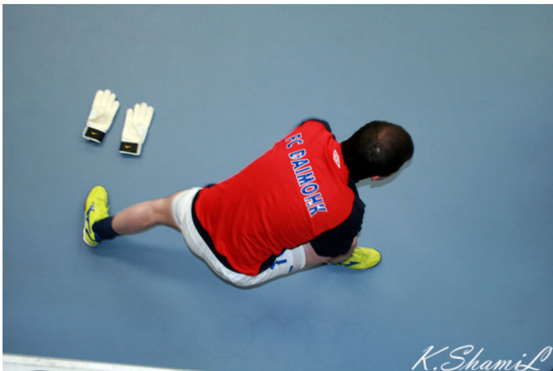
Вратарь "Даймохка" разминается