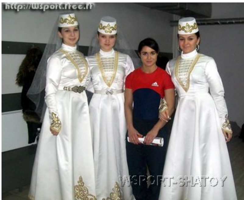
На чемпионате России 2009 года в Нальчике