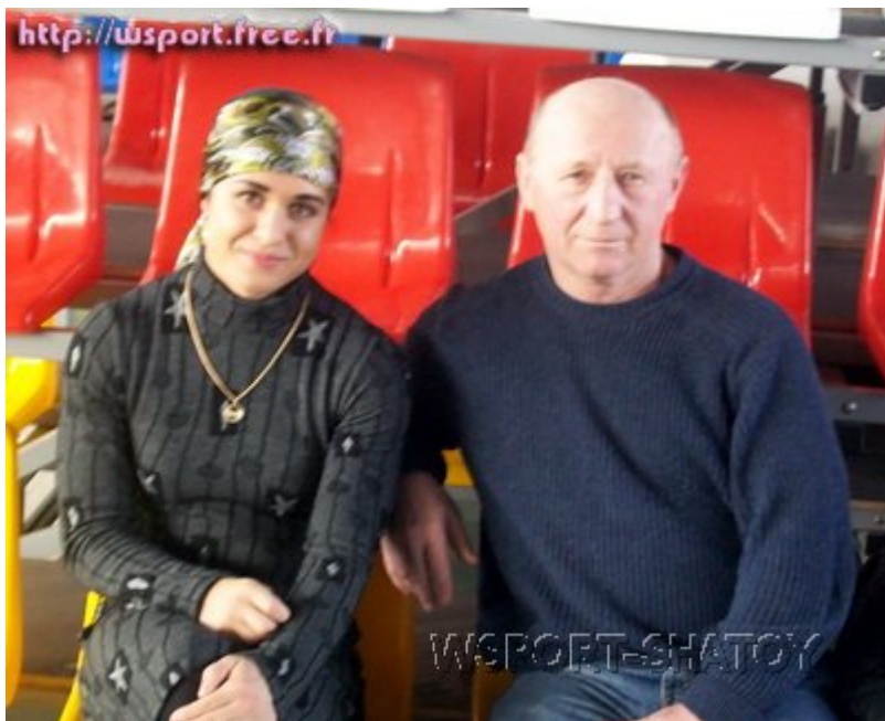
С главным тренером женской сборной России Солтаном Каракотовым