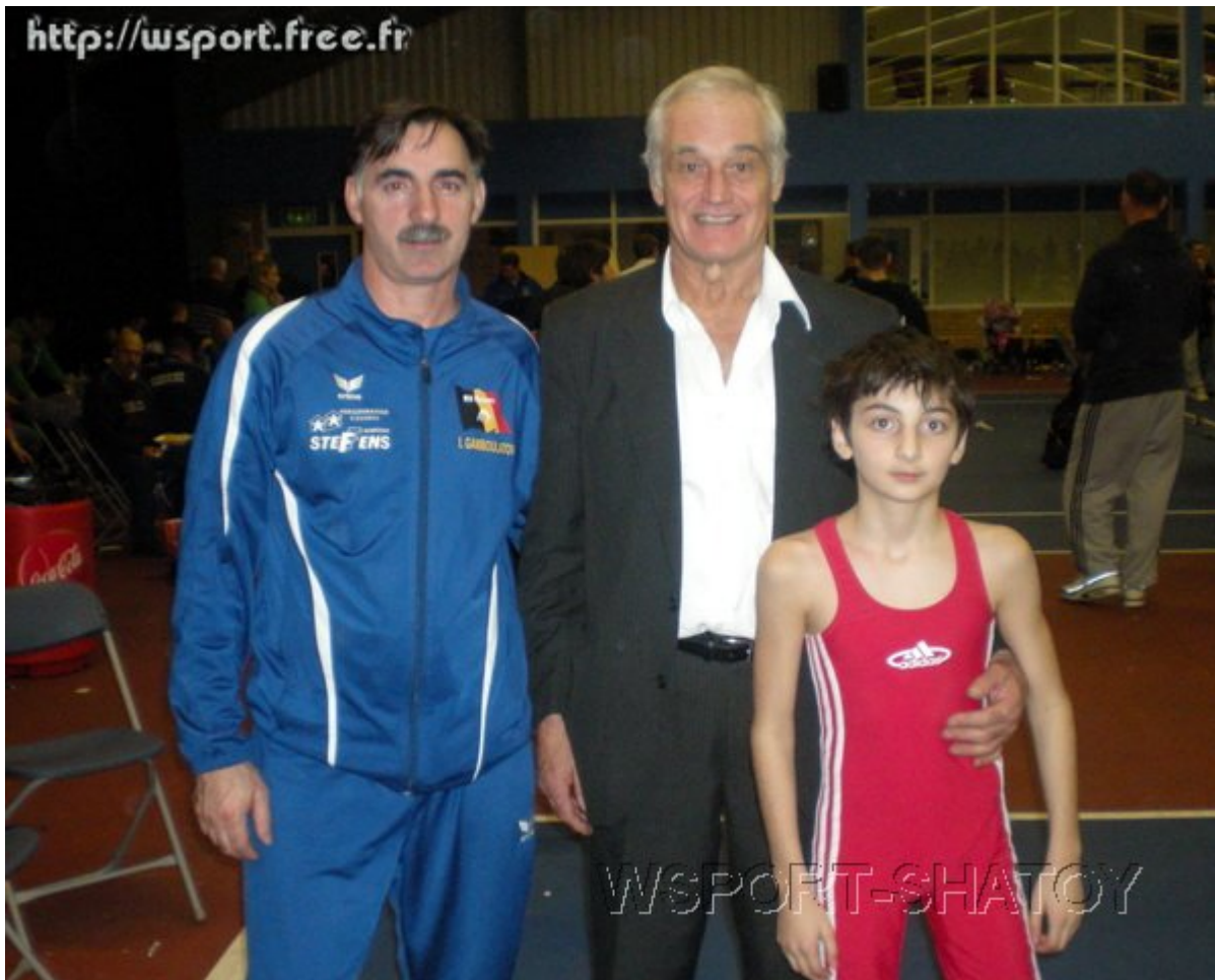
В центре Рой Вуд, бывший спортсмен-профессионал, один из основоположников современной английской борьбы.