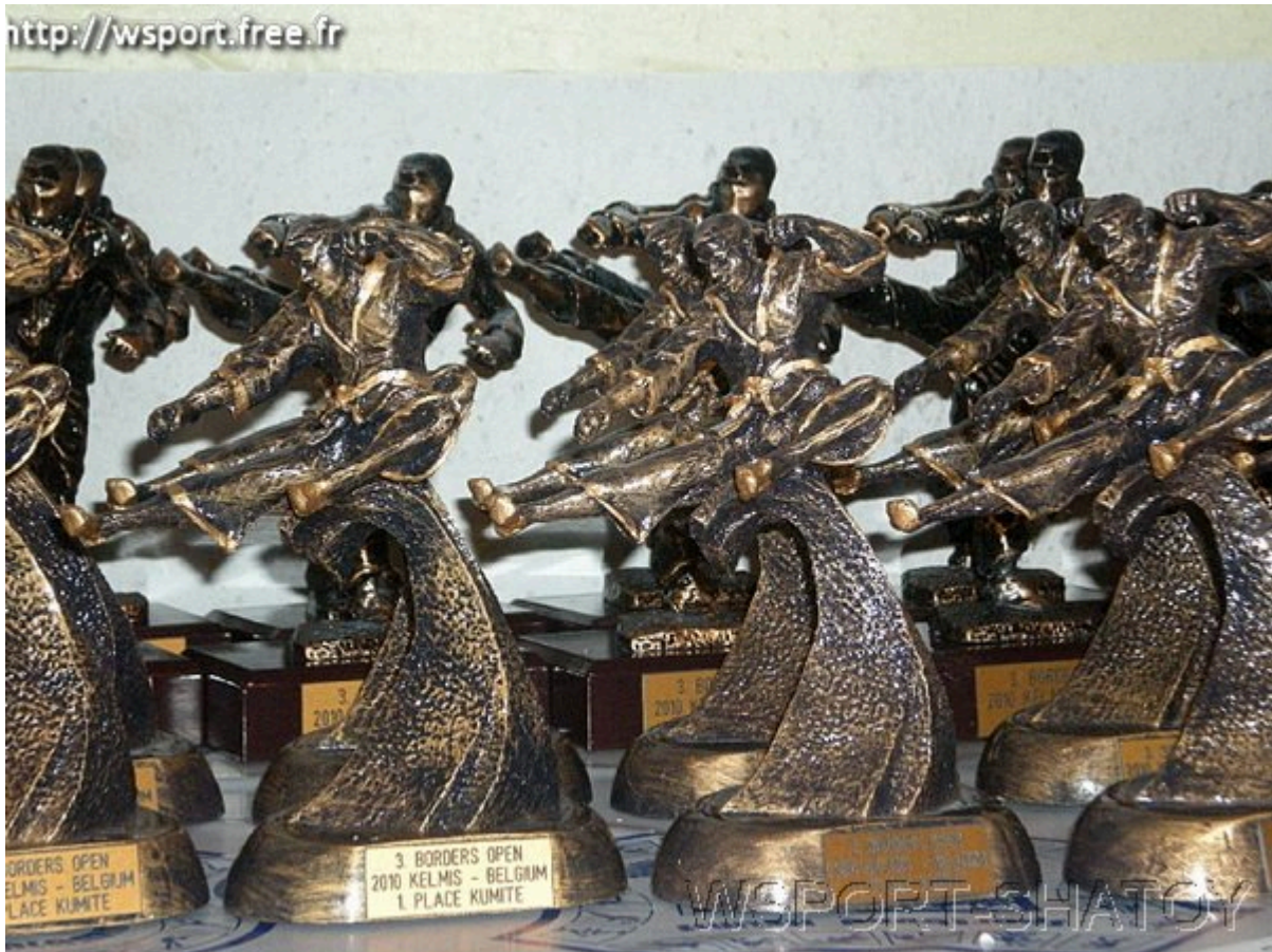
Награды для призеров