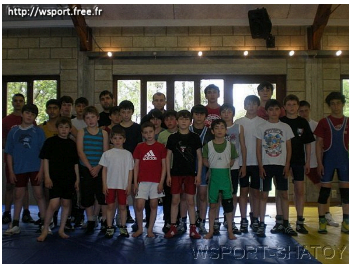
Вайнахские спортсмены на тренировочном сборе