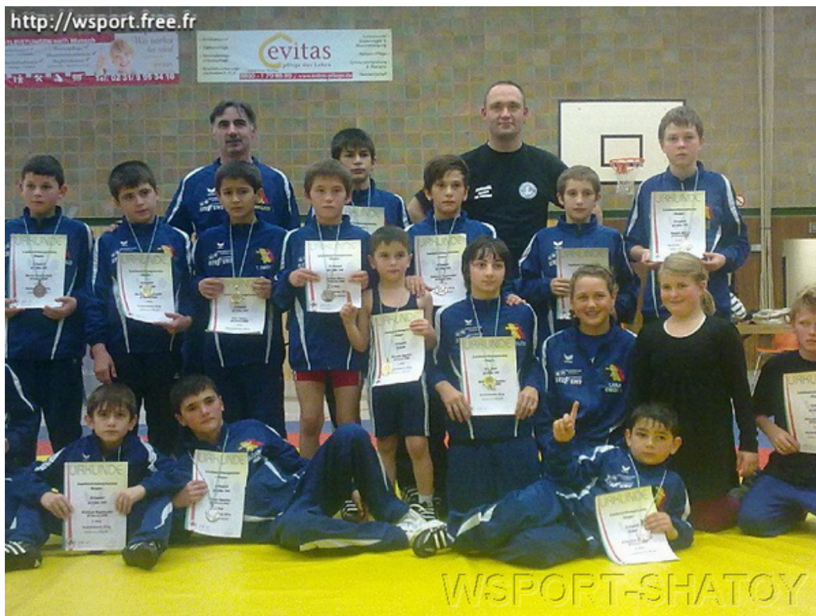
Команда «Раерен 2006» из Бельгии – безоговорочный лидер турнира

стали несколько родителей спортсменов, которые помогли ассистировать борцам.