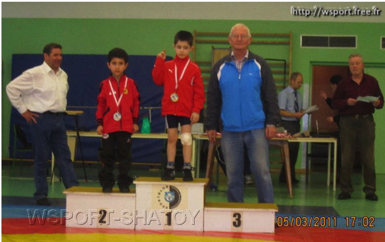
Чемпион Хамзат Раджапов