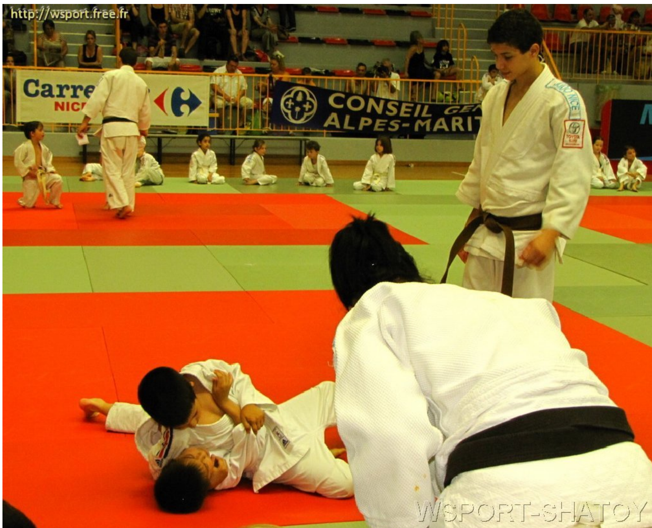
Наим удерживает соперника