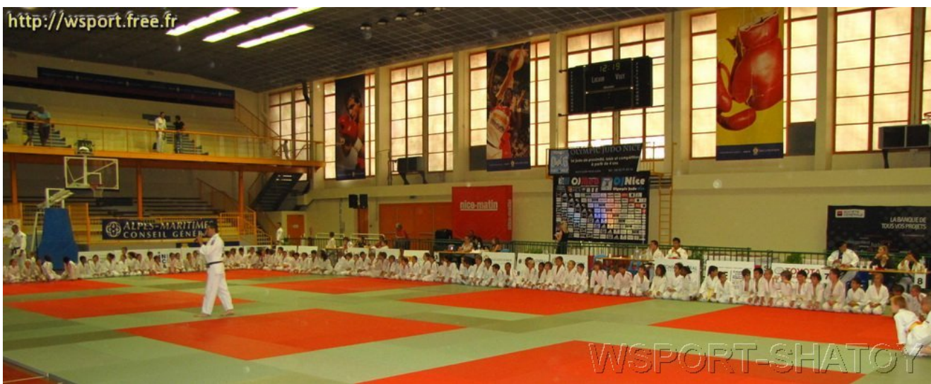
Участники соревнований 2003-2004 годов рождения