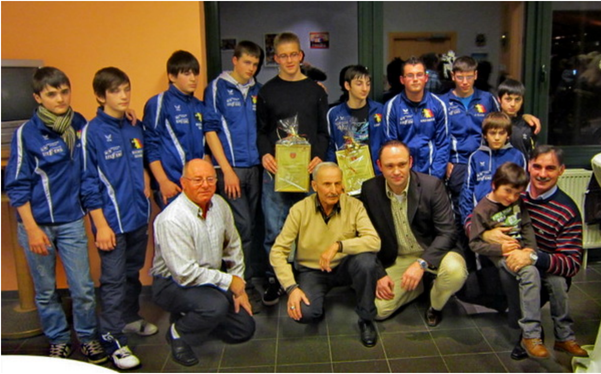
Лучший клуб 2011 года - "Раерен 2006"