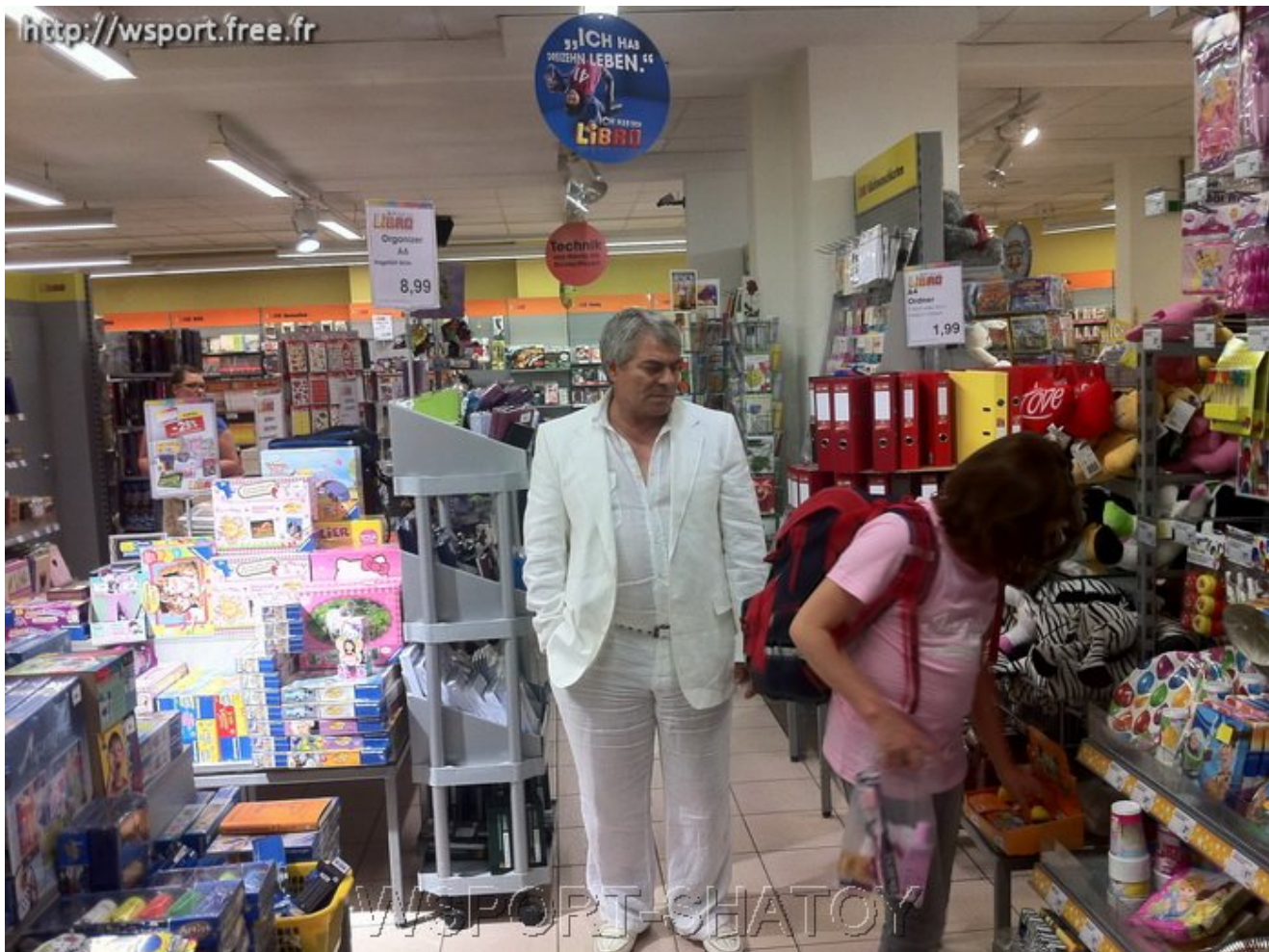
Руслан часто видит фотографию сына в магазинах