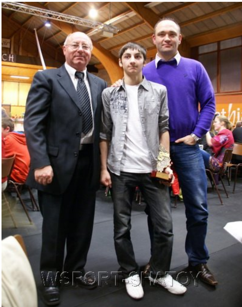
Президент и тренер клуба, где Джохар тренируется