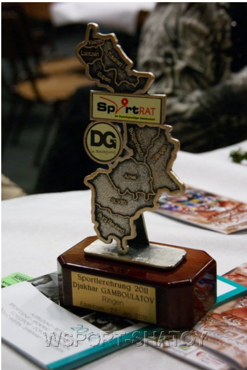
Приз лучшего спортсмена Восточной Бельгии