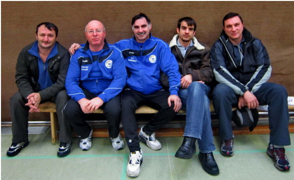
Руководство спортклуба "Раерен 2006", родители спортсменов