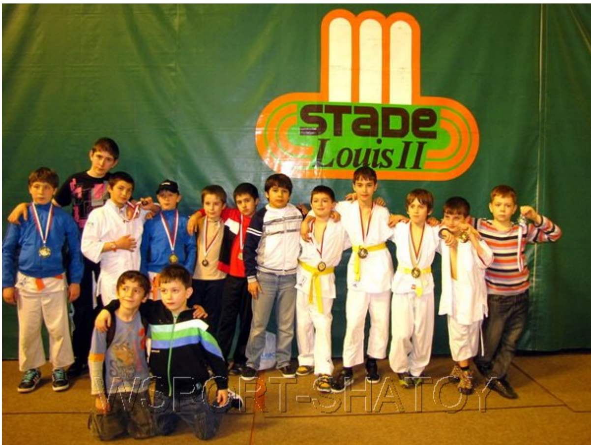
Наши чемпионы и призеры