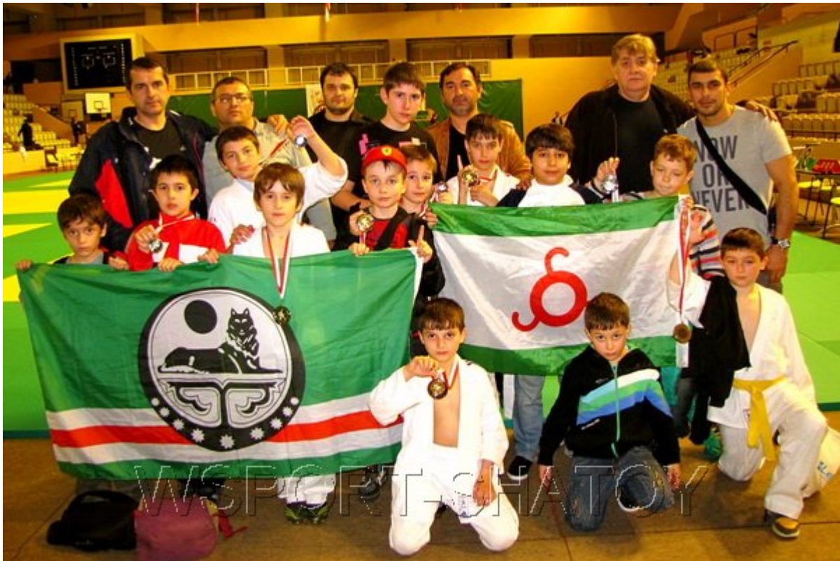
Родители, спортсмены, тренер.