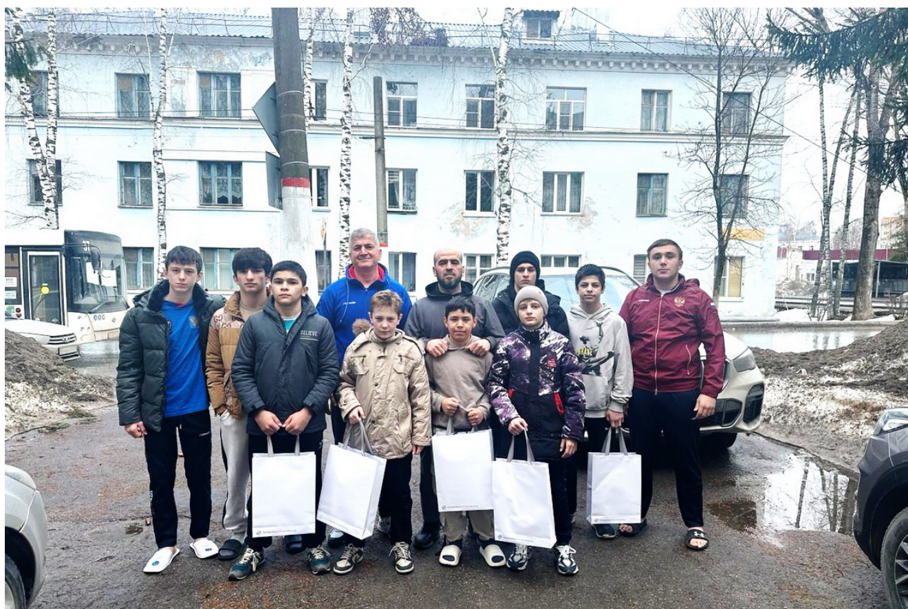
Спортсмены Грозного и Хасавюрта с подарками от Аюба