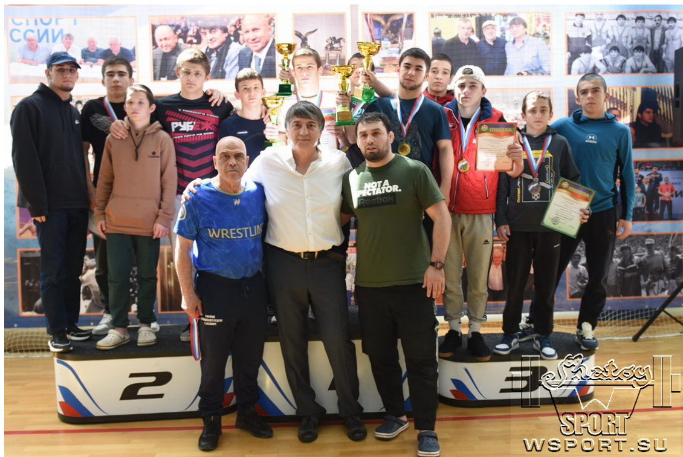
Для просмотра фотоальбома кликните на фото ниже.

После завершения турнира почетные гости посетили аллею спортивной Славы Карачаево-Черкесской Республики.