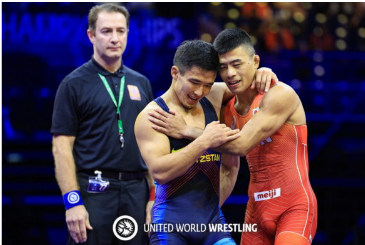
Чемпионат Европы-2024, Бухарест, Румыния.