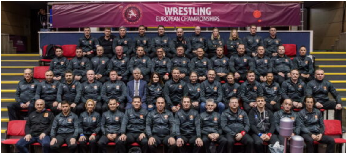
Квалификационные олимпийские турниры в Турции и Азербайджане.